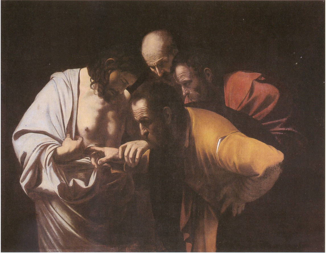
fig. a Caravaggio - Der ungläubige Thomas (1601 – 02) Öl auf Leinwand, 115 x 146 cm Neues Palais, Potsdam