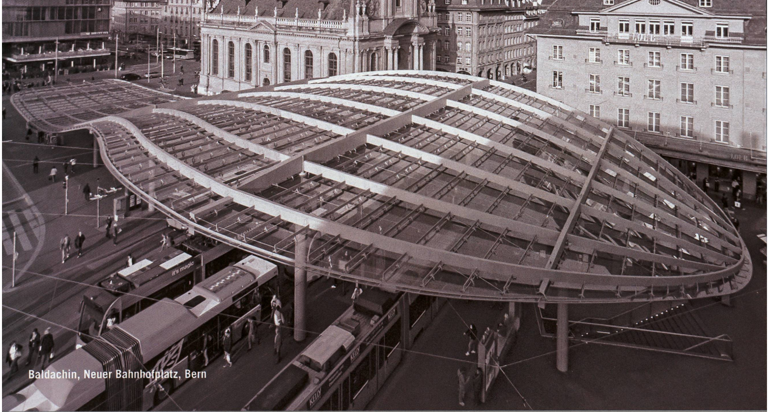
Baldachin, Neuer Bahnhofplatz, Bern

Partner für anspruchsvolle Projekte in Stahl und Glas