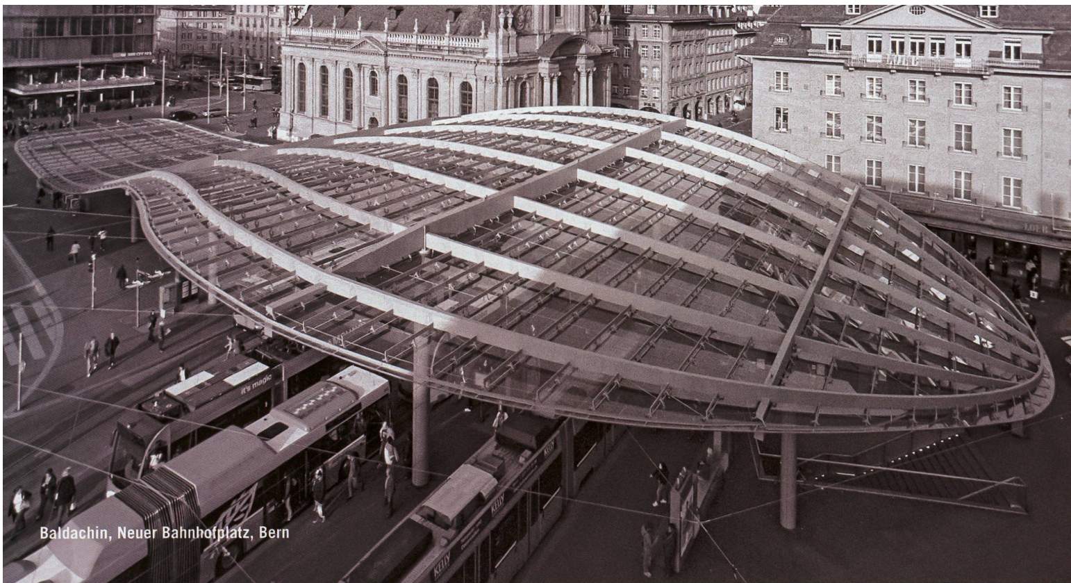
Baldachin, Neuer Bahnhofplatz, Bern

Partner für anspruchsvolle Projekte in Stahl und Glas