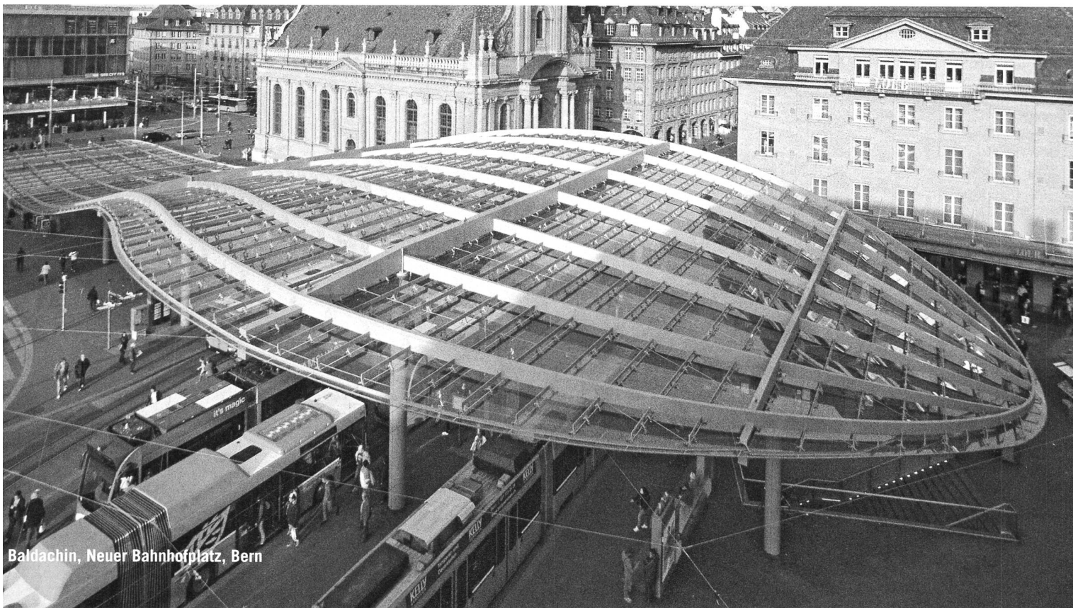
Baldachin, Neuer Bahnhofplatz, Bern

michelle.durham@bastianello.net hänggerstasse 105 CH-8037 zürich +41 (0)44 440 60 89