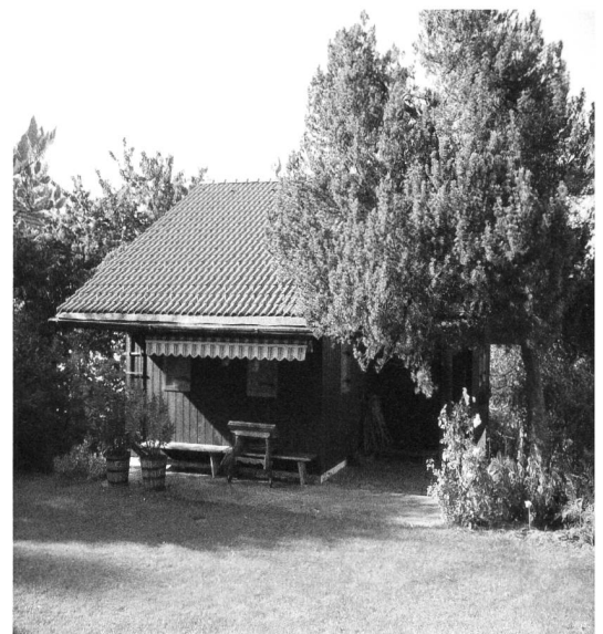
«dort im Chalet in den Bergen», ohne Ort, 2006