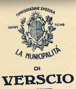
Busta di trasmissione e estratto del Foglio ufficiale inviato a tutti i proprietari toccati dal raggruppamento.