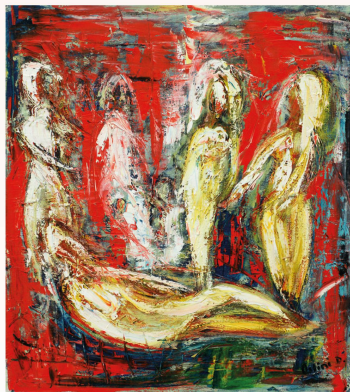
"Il passato" Caron Dominio