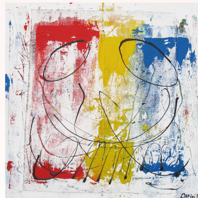
"Il presente" Maternità

Penso che la gente, particolarmente ai nostri giorni, abbia bisogno di positività, di credere in sé stessa, di scoprire nuovamente le cose belle; attraverso i colori vivi si scatena in essa un processo riabilitativo verso tutto ciò che rende felici e consapevoli di una bellezza universale. I miei colori e i miei segni stabiliscono un rapporto diretto e sincero con lo spettatore e parlano un linguaggio creativo.