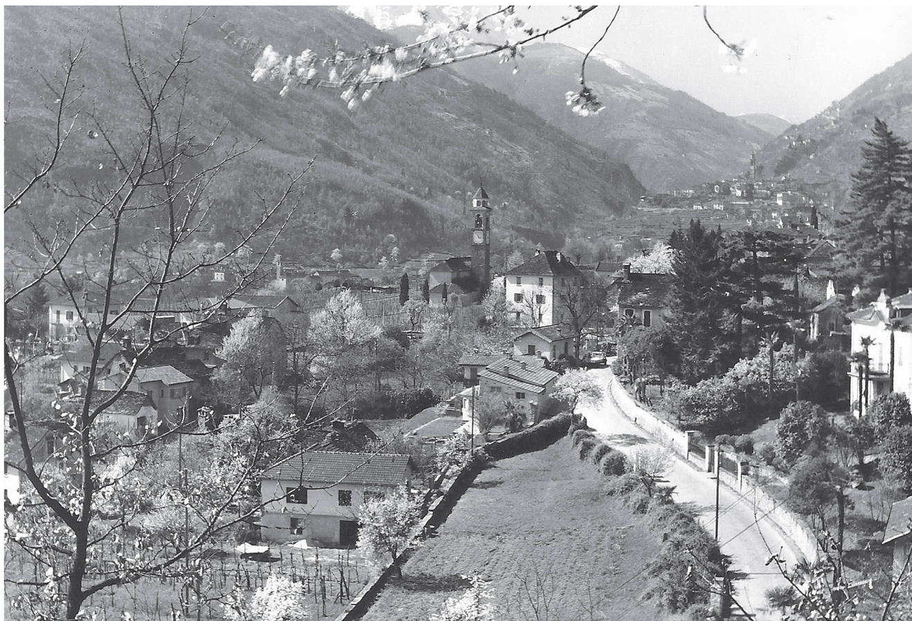
Cavigliano anni 50