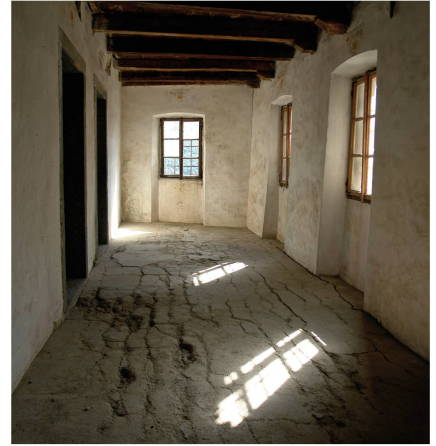
Copertina: Interno del Palazzo Tondù a Lionza

Auguri di Buone Feste e di un Felice Anno Nuovo a tutti i nostri fedeli lettori