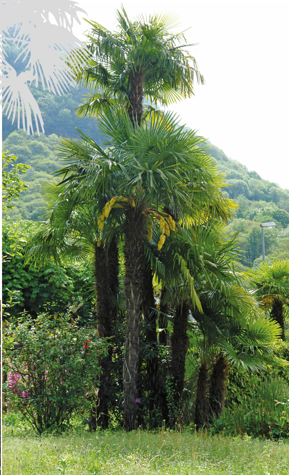
Insieme di palme di età diversa.