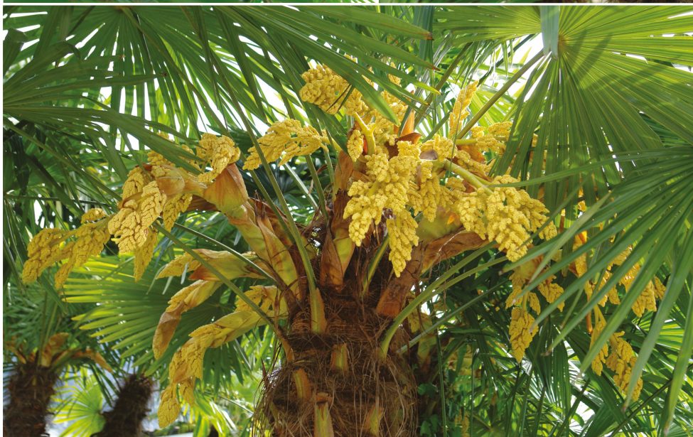
Infiorescenze ramoso curve.