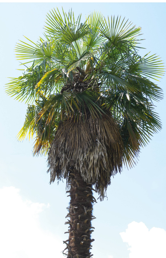
Palma nel suo aspetto naturale.