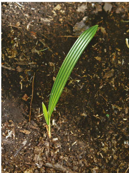
Piantina da poco germinata.

È una Palma , ma quale? Se ne contano circa 210 specie e 2780 sottospecie (vedi HORTUS THIRD DI L.H. BAYLEY & E.Z. BAYLEY, 1978, pag. 812 ). Spesso si sente dire con espressione di meraviglia da chi giunge in Ticino dal Nord delle Alpi: è la Palma del Mediterraneo. Ed è qui che, anche per chi è quotidianamente a contatto con questo albero cresciuto quasi a ridosso della propria abitazione e fissato saldamente al suolo con possenti radici, diventa difficile conoscerne il nome.