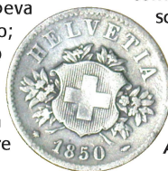
Il 20 cts più vecchio (1850) trovato da tre squadre: Vampiri (Verscio), Cobra (Intragna), Aquile (Cavigliano)

Quando alla scuola di Cavigliano abbiamo illustrato il programma della ricerca del Topolino più vecchio vi è stata una simpatica bambina, penso che frequentasse la prima elementare, che si mostrava molto preoccupata. Infatti, pur con tutta la buona volontà non sapeva proprio dove scovare un topolino; non ne aveva mai visto uno in giro per Cavigliano, figuriamoci poi se doveva pure essere vecchio. Dopo un po' abbiamo capito che la bambina pensava di dovere cercare un topolino vecchio e vivo!