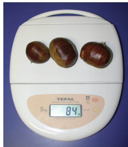
Le castagne più grosse trovate dalla squadra dei Vampiri (Verscio)