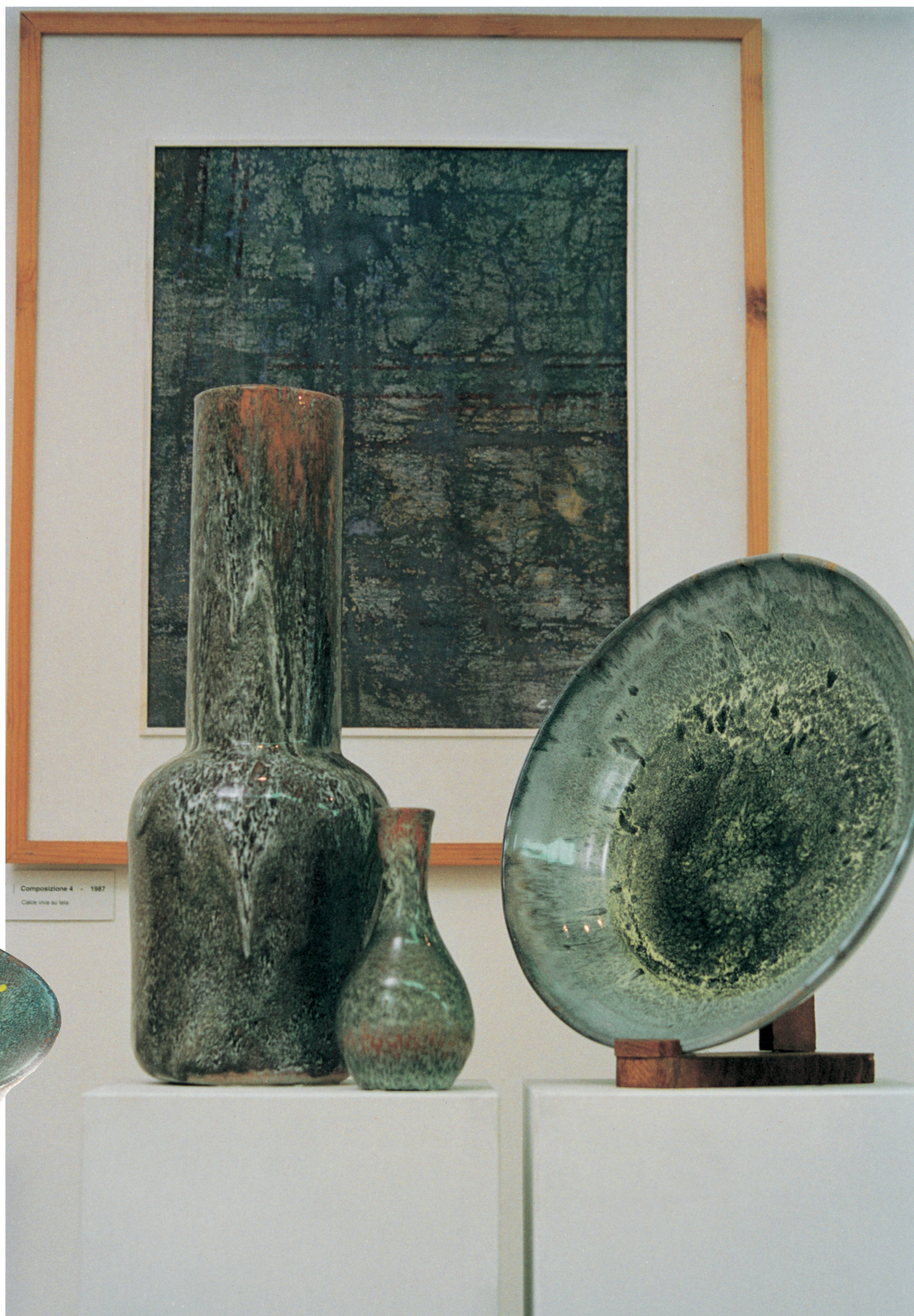
Composizione 4 - 1987 Calce viva su tela