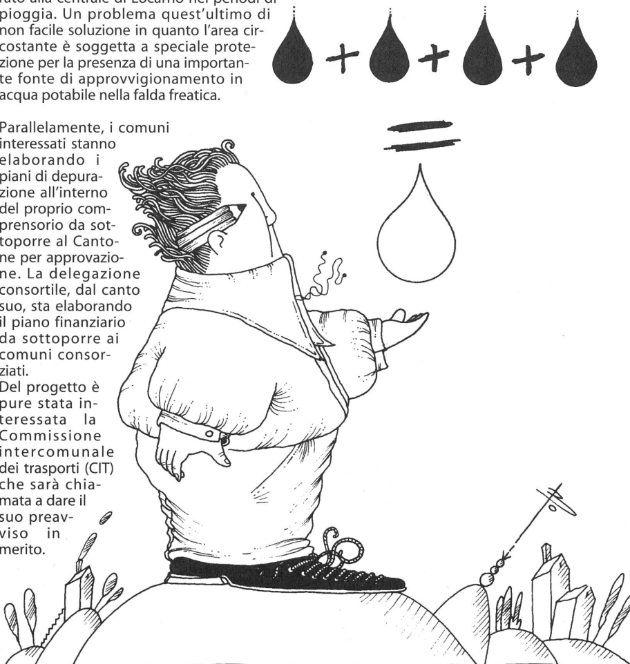
Illustrazione di Roberto Grizzi