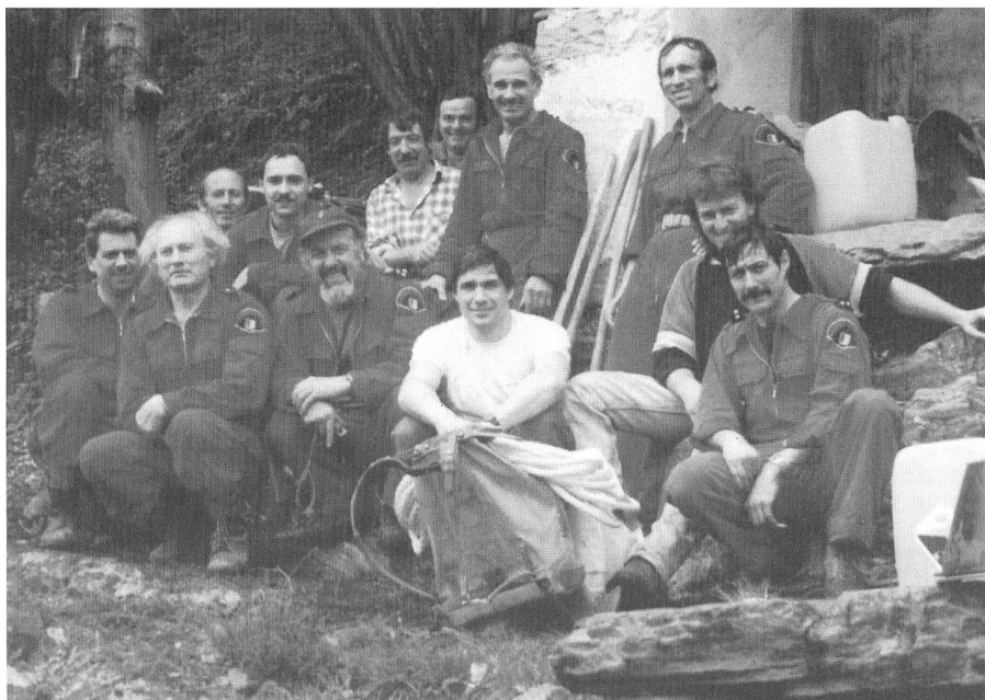
Il gruppo dei pompieri di montagna di Cavigliano che ha partecipato ai lavori.