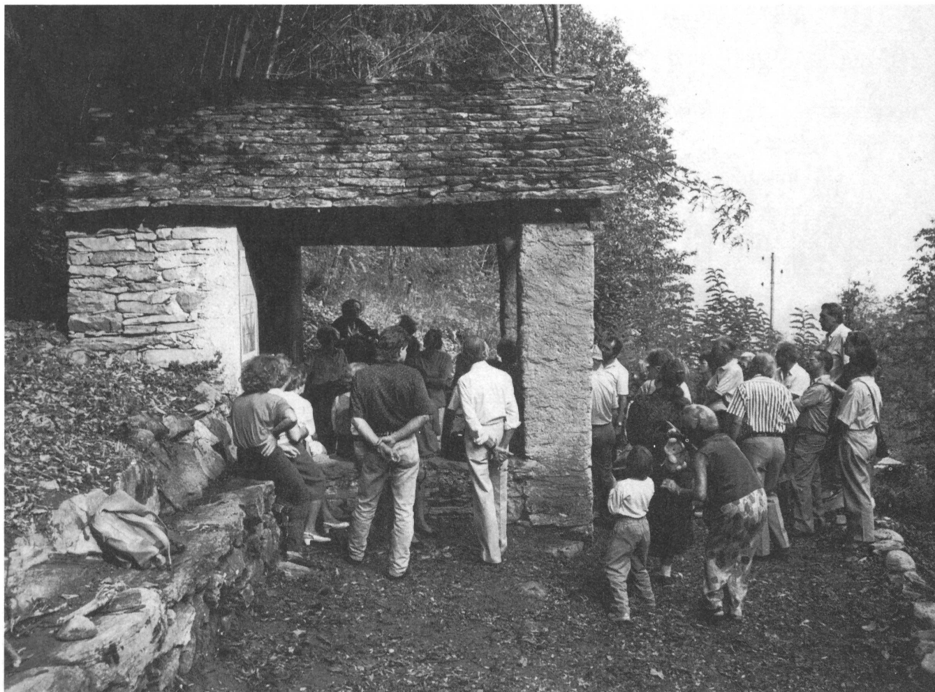
Gli «Amici dei Musei» mentre ammirano la «Capèla du Peri» a Cavigliano, recentemente restaurata grazie al loro generoso contributo finanziario.