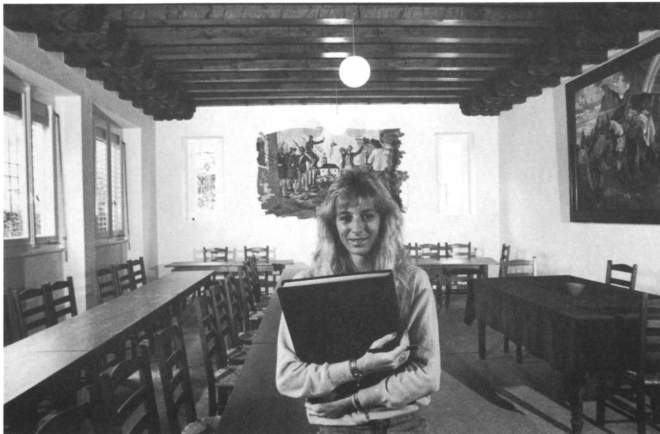
La nuova segretaria comunale nel rinnovato salone.

Che questa operazione sia forse il preludio alla completa pedonalizzazione della bella piazza di Tegna, circondata da antiche case e platani, e lo spostamento dei posteggi in altro luogo?