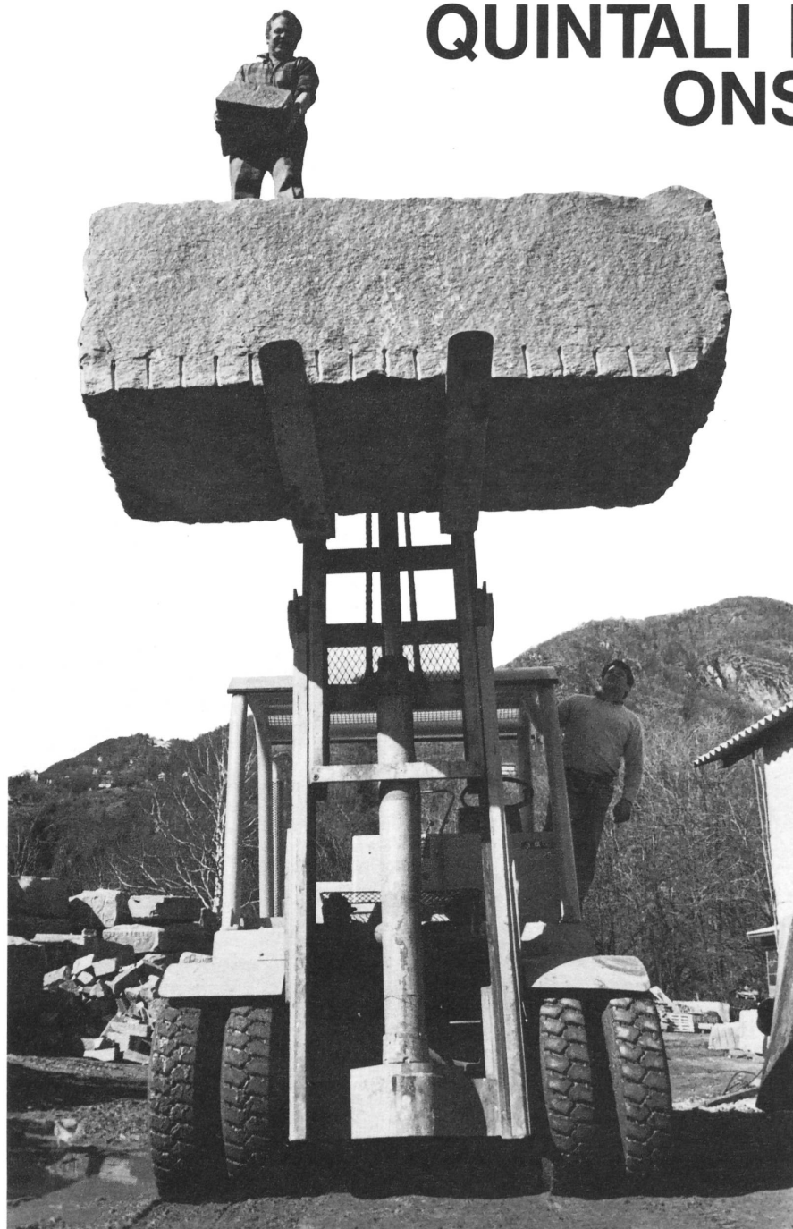
Un'immagine simbolica dell'evoluzione tecnica registrata in questo campo: mentre il padre, senza macchine, poteva sollevare blocchi di granito di 50 chilogrammi, il figlio sposta massi di 15 tonnellate...

L'acqua che occorre per questo lavoro circola in un circuito chiuso e viene costantemente ripulita da un depuratore che la ditta ha installato anche per evitare ogni inquinamento. Il rifornimento in diverse cisterne avviene tramite raccolta dell'ac-