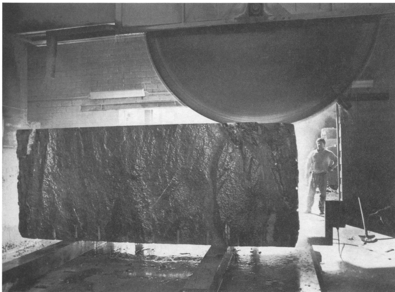
Una fresa in azione: per tagliare blocchi di queste dimensioni impiega 24 ore. In alto a destra la tradizionale immagine dello scalpellino al lavoro. Accanto gioco plastico formato da blocchi di granito lavorati.