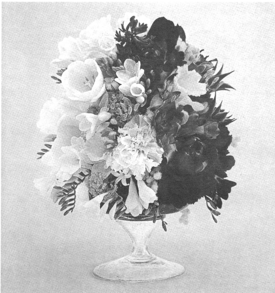
Composizione a boccia.

I fiori come oggetto decorativo sono parte integrante di un arredamento. L'arte di comporre i fiori è saper creare la composizione adatta a ogni stile di arredamento; adattare i fiori ai vasi giusti o agli oggetti in funzione del loro scopo.