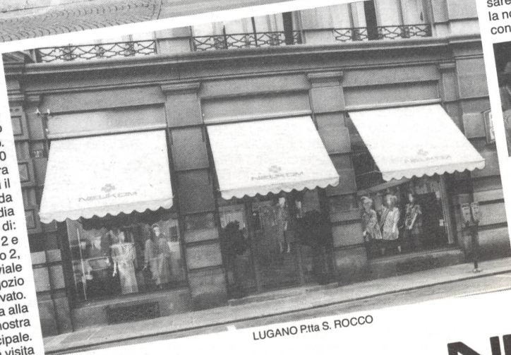
LUGANO PIAZZA S. ROCCO