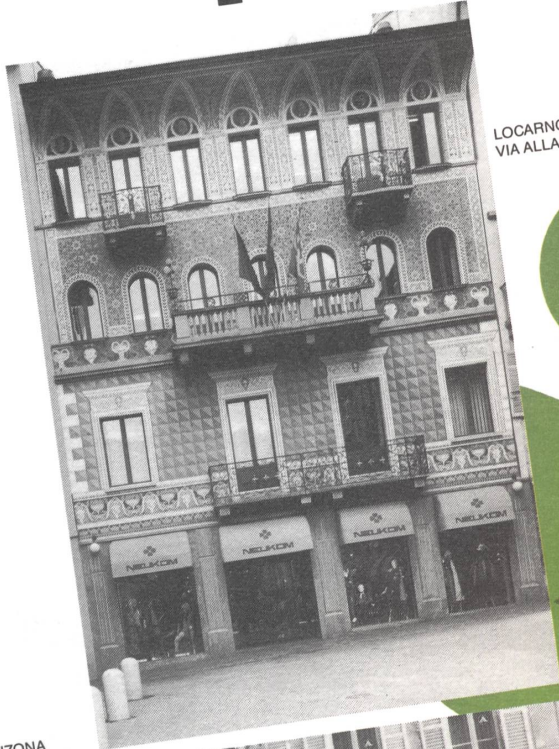
LOCARNO VIA ALLA RAMOGNA