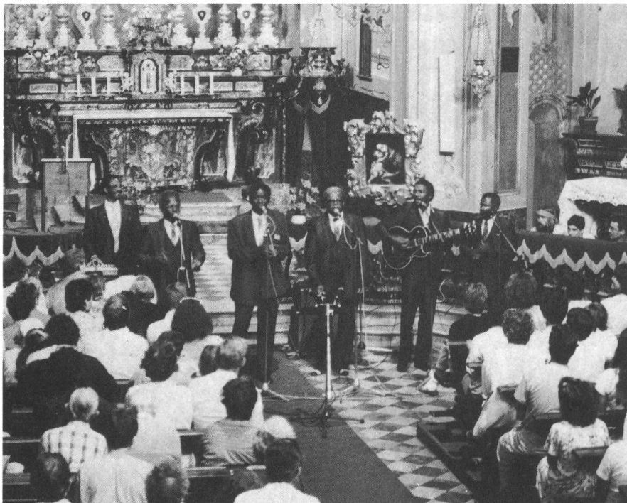
Concerto «Gospel» del gruppo The Zion Harmonizers tenuto nella chiesa di Verscio lo scorso mese di giugno.