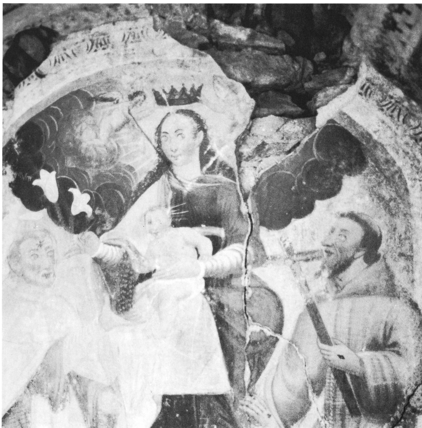
Cappella di Riei: Incoronazione della Madonna con San Vincenzo Ferreri e San Francesco d'Assisi.