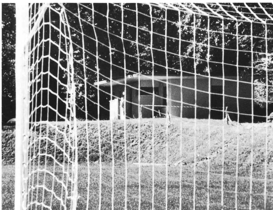
Gli spogliatoi di recente costruzione.