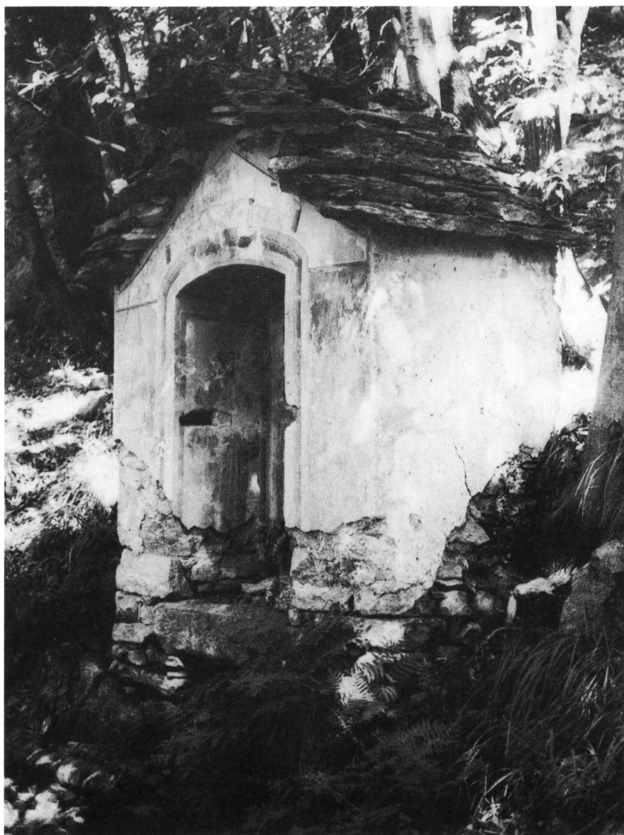
Lo stato fatiscente della «Capela du Padass».

competenti nel ramo per non correre il rischio di rovinarli.