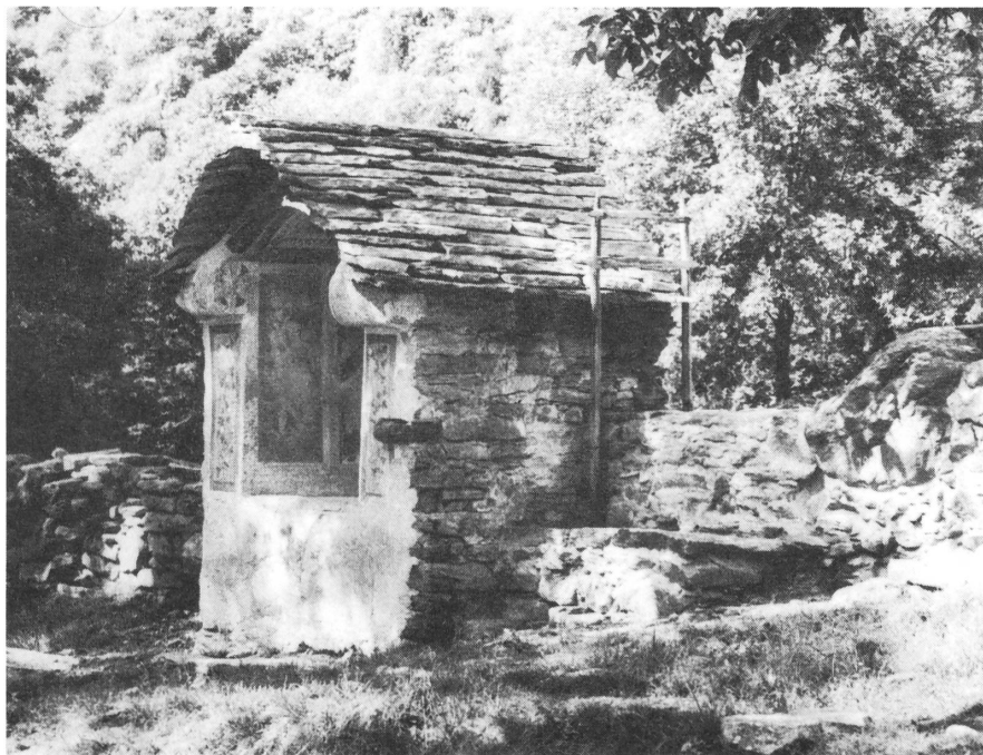
La cappella di Riei dopo l'intervento della scorsa estate.

Come avevamo preannunciato, durante il corso dell'estate, abbiamo fatto eseguire importanti lavori di consolidamento e di protezione alla cappella di Riei, liberandola dai detriti che provocavano infiltrazioni di umidità proveniente dal terreno. Alla stessa, è poi stato rifatto completamente il tetto in piode per cui non si deve più temere il crollo di questo prezioso tempio dei nostri monti. Non sono stati invece toccati gli affreschi poiché il loro restauro dovrà essere affidato a persone