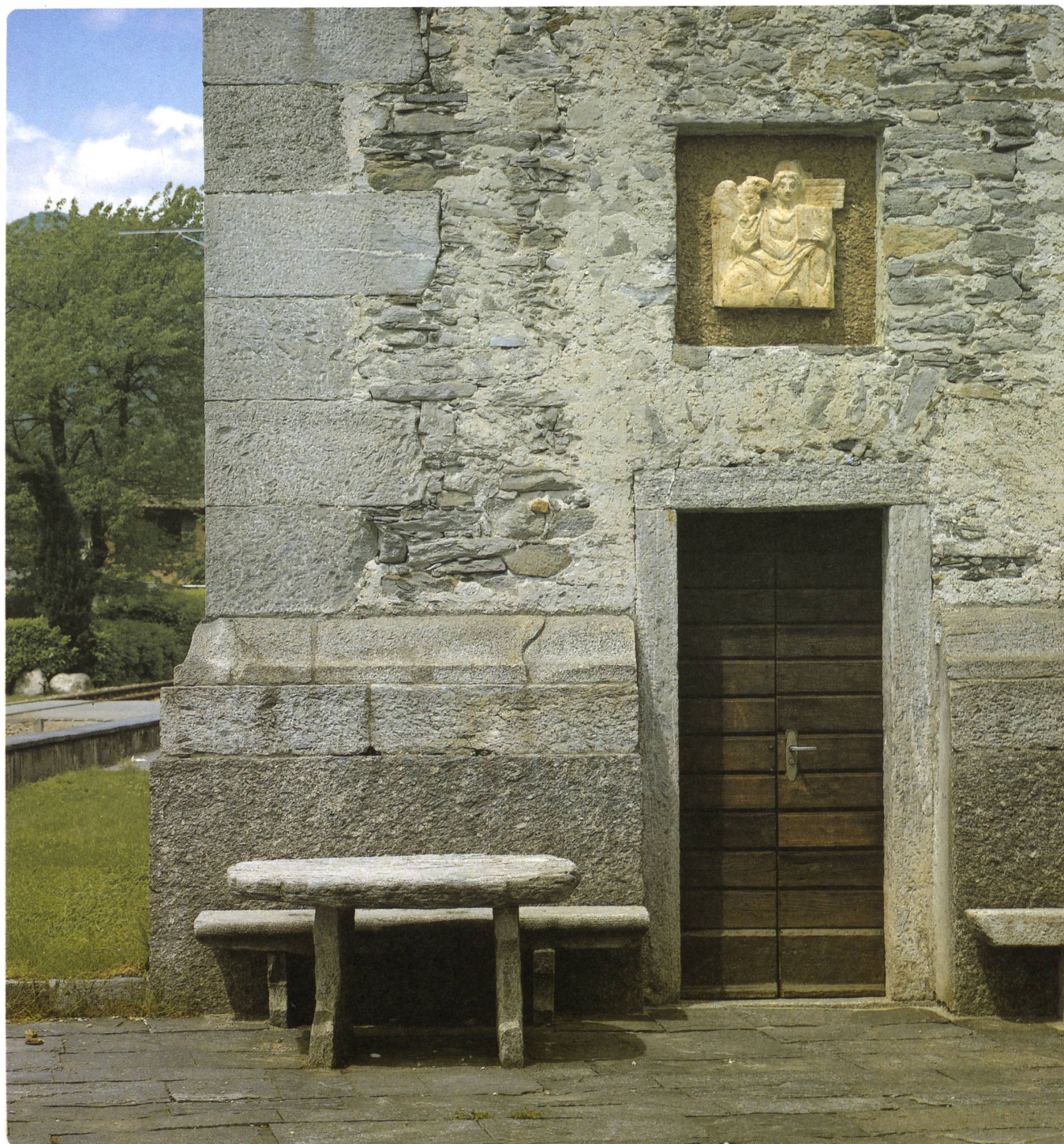
Particolare del campanile di Tegna col San Giovanni evangelista di Remo Rossi

Cappelle da salvare Tegna: La Madonna delle Scalate