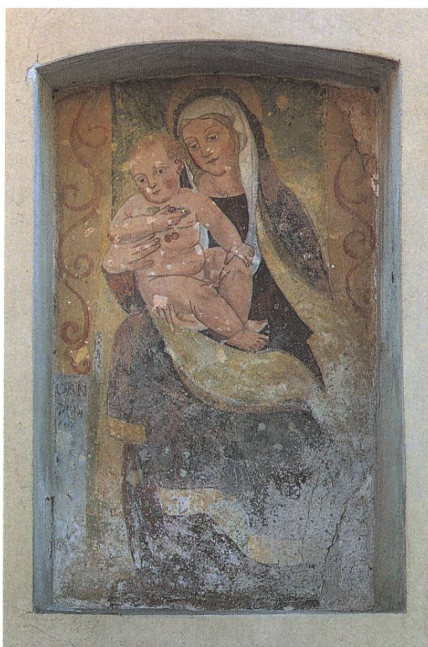
17. Case dei Franci: Madonna col Bambino in un affresco del primo Cinquecento, attribuito ad Antonio da Tradate.