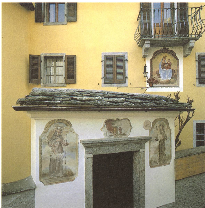
2. 3. Caraa du Vanin: angolo caratteristico del vecchio nucleo di Verscio. Sul portale del 1818, San Francesco da Paola e San Francesco d'Assisi attorniano lo stemma dei Leoni. Sulla facciata della casa, la Madonna di Montenero, in un affresco del 1819.