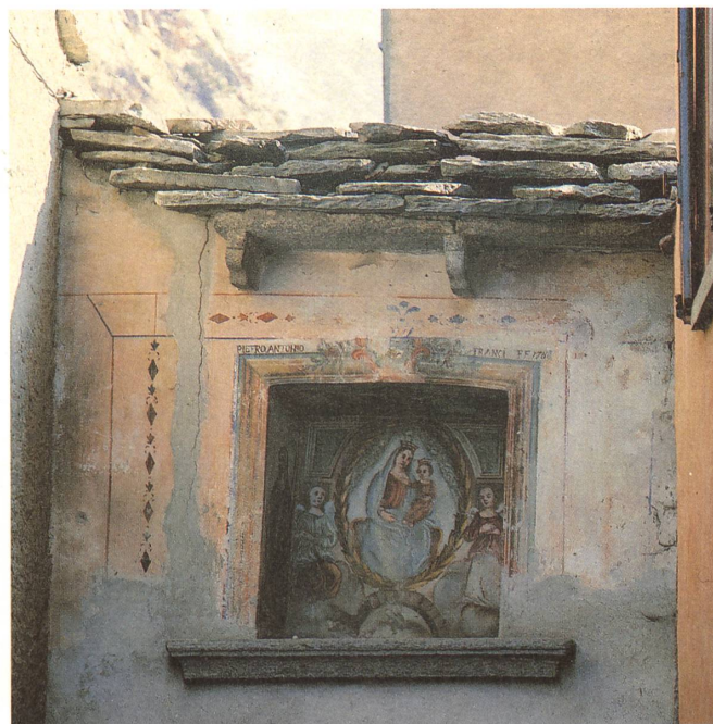
19. Case dei Franci: edicola con pittura votiva fatta affrescare nel 1782 da Pietro Franci sul fronte ovest del portale di casa. Vi figurano la Madonna di Montenero attorniata da angeli, l'Eterno Padre e due Santi. Nella parte bassa dell'affresco è dipinta la scena per la quale fu ricevuta la grazia: un ponte, una figura emergente dalle acque, un cavallo imbizzarrito.