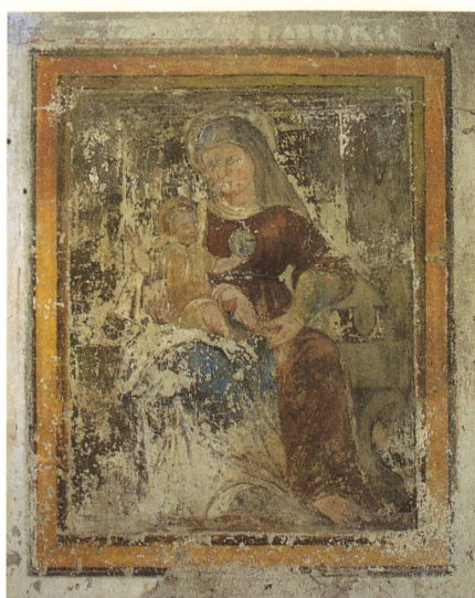
30. Madonna col Bambino sotto la loggia di una vecchia casa, lungo la strada cantonale. Il cattivo stato dell'affresco lascia ancora intravedere lo splendore di un tempo.