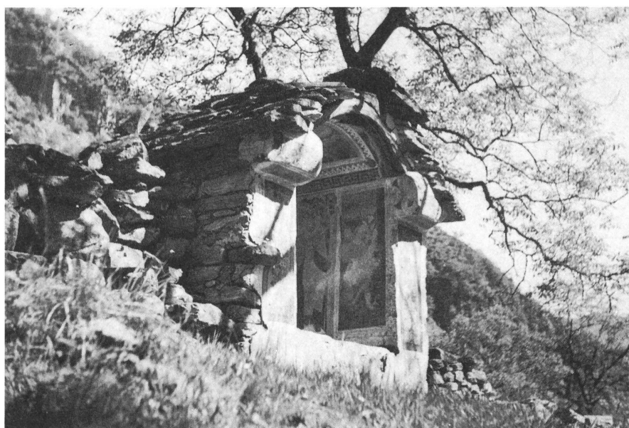
Verscio: veduta complessiva della cappella di Riei.