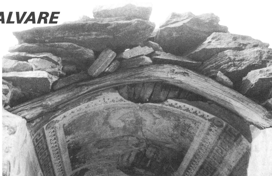
Verscio: cappella di Riei, danni del tempo e dell'incuria.