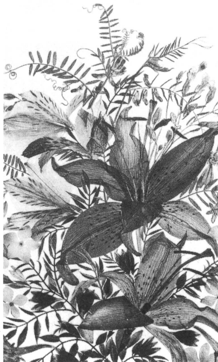
Un collage di Tilde Gerosa

Il 15 aprile, presso la Galleria Pegasus, nella «Casa del principe», si è inaugurata una mostra dedicata a Tilde Gerosa, autrice di collages floreali. La presentazione di questa artista è di Piero Chiara.