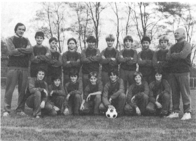
Allievi C Verscio