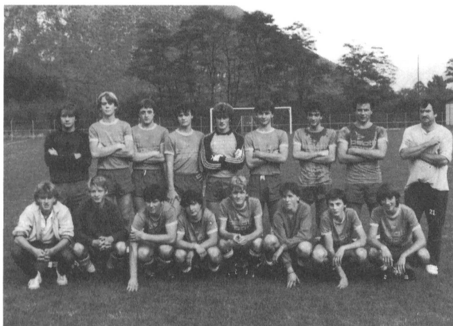
Allievi A Verscio

E ora, a mo' di conclusione, una nostra semplice constatazione che vuole anche essere un invito ai due sodalizi, US Verscio e AS Tegna: nelle nostre Terre c'è tanta gioventù che merita veramente una più stretta collaborazione dei due sodalizi, al di là dei nostri campanili che, in fondo, quasi si toccano.