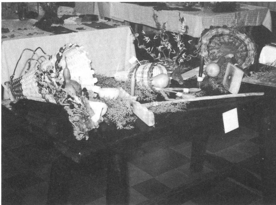
Uno scorcio della mostra