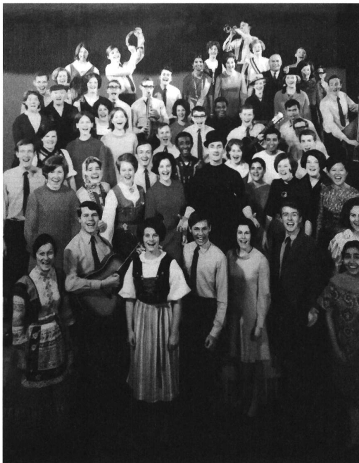
Abb. 2: Photo de la troupe Anything To Declare , 1967 env.

le spectacle européen est Joan of Arc . De plus, ce dernier laisse aux chants traditionnels une place plus importante avec des titres comme Folklore comprenant des couplets tels qu'une reprise du Kalinka russe précédé du yodle Vo Luzern uf Wäggis zue en suisse-allemand. 65