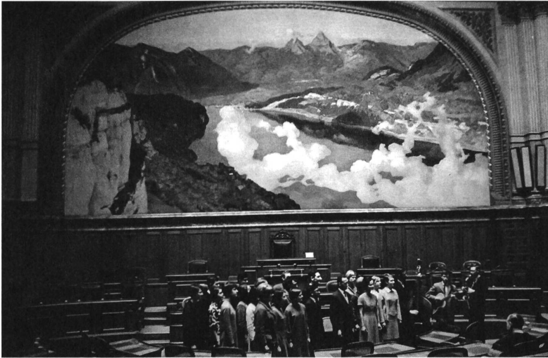
Abb. 3: Photo de la troupe Anything To Declare , 1967 env.

son successeur Song Of Asia (SOA) dans le Jura en 1971, trois ans après qu'ATD a donné des représentations pour les écoles de Bienne 83 et avant que SOA y revienne en 1976? 84 Afin d'optimiser la «conjoncture de réceptivité» du spectacle parmi un nouveau public, 85 les dirigeants anglais et suisses réalisent l'importance, après l'expérience controversée de la représentation trop américanisée de SOD à Zurich, non seulement du procédé nécessaire de traduction – permettant selon Marc Crépon d'éviter l'adhésion à un discours identitaire alarmiste et nationaliste 86 – mais également d'une prise en compte des contextes culturels, historiques et du lien entre les pays responsables de l'import-export du modèle, 87 En plus de nous donner l'occasion d'observer les mécanismes de reconfigurations inhérentes à l'influence d'un modèle étranger que mentionnent Matthieu Gillibert et Pauline Milani, 88 l'épisode des revues musicales RAM illustre la capacité des mouvements conservateurs à réinventer leurs formes de pratiques tout en offrant le même type de discours. Nous assistons ici à une récupération de la figure du révolutionnaire à l'aide de la prise en compte des problèmes de société des années 1960 et de la réappropriation des moyens d'expression en vogue. L'apologie de valeurs traditionnelles et l'adhésion aux principes du RAM sont proposées comme de meilleures alternatives face à la «Nouvelle-Gauche contre-culturelle.» 89