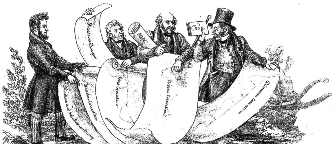
Fig. 1: Caricature de Martin Disteli, Solothurner Blatt 1 (1840), 1.

discours publics de la Restauration, les réformateurs soleurois appellent de leurs vœux, aux côtés d'un renforcement de l'éducation religieuse, une instruction géographique spécifique (« Erd- und Völkerkunde ») 21 C'est ainsi qu'en 1820, l'almanach soleurois Volkskalender publie une description détaillée de la «petite République» (« kleiner Freystaat ») qu'est Soleure, alliant la géographie purement physique (montagnes, fleuves) à des données de géographie culturelle (religions, agriculture, situation économique et institutions). Les mêmes éléments se retrouvent d'ailleurs dans le manuel du professeur de physique et de mathématiques Willibald Schmid (1786–1844), paru la même année à Soleure. 22 Schmid introduit ce qu'il nomme « bürgerliche Geographie », recensant les différentes formes de gouvernements en Europe. La description de la Suisse – au chapitre «Europe» – est particulièrement révélatrice si l'on considère que la géographie représente l'ordre des choses: l'auteur inventorie d'abord la position géographique de la Suisse et sa population, puis aborde les mœurs et les langues, sans oublier les grands savants suisses, le commerce et l'industrie, avant de terminer par la géographie physique (les montagnes, fleuves et lacs); chaque canton est ensuite décrit avec ses curiosités.