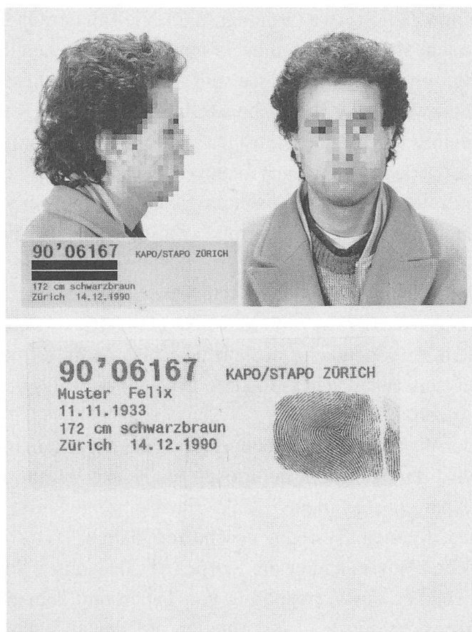
Abb. 3: Vorder- und Rückseite «90'06167 Muster Felix». (StAZH, Z 263.20)

nummer in der Signalementsdatenbank dennoch die abbildende Funktion sowohl des verbalisierten, wie auch des fotografischen Verbrecherbildes zulasten seiner anzeigenden weiter auf. Denn die Beamten suchten nach äusseren Merkmalen von Kriminellen; der Nutzen der abfragbaren Signalementsdaten lag daher in ihrer visuellen Beschreibung. Der Verweis auf die realitätstreue Abbildungsqualität der Polizeifotos einer gesuchten Person untermauerte die Abbildungsfunktion des Signalements.