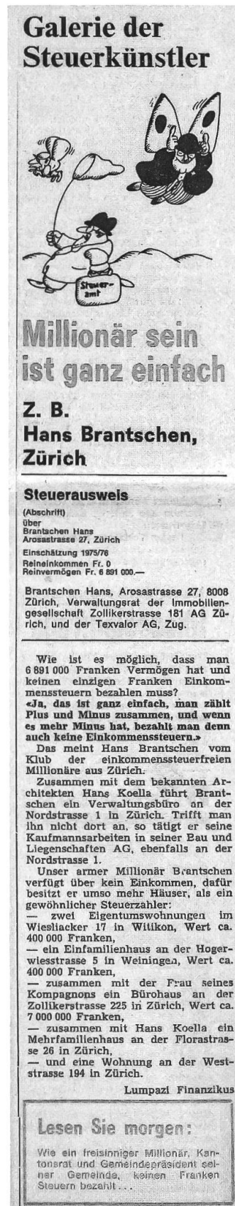
Abb. 4: Artikel der Serie «Galerie der Steuerkünstler» aus dem «Volksrecht» vom 26. November 1977.