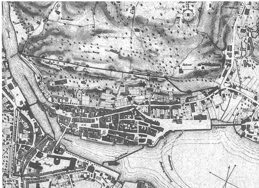
Abb. 4 und 5: Die Stadt Luzern – Ausschnitte der Pläne von 1840 (oben) und 1848 (unten). Der Plan von 1848 konzentriert sich auf die Aufschüttung des Quais im Bereich des Hotels Schweizerhof.