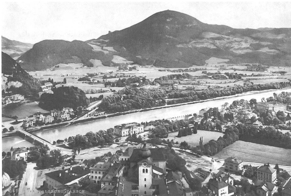
Abb. 2: Ansicht der begradigten Salzach oberhalb des Stadtzentrums von Salzburg. Blick von der Festung Hohensalzburg, kolorierte Fotografie, um 1900. (Postkarte)