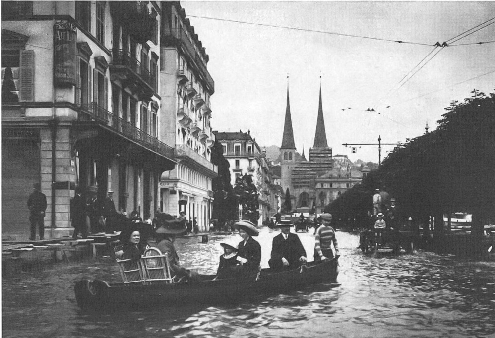
Abb. 7: Luzern während des Hochwassers 1910. Blick entlang des Schweizerhofquais zur Hofkirche St. Leodegar. (Fotografie, Stadtarchiv Luzern, F2a/Naturereignisse/19.XIV:3)

Hochwasser von 1910 andernorts in der Innerschweiz massive Zerstörungen anrichtete, so suggerieren die zahlreichen Fotografien vom Luzerner Seeufer eine fast romantische Einstellung der Bevölkerung zu den Auswirkungen der Überschwemmung. Dies mag daran liegen, dass sich der finanzielle Schaden in Grenzen hielt und eine soziale Schicht traf, der daraus vermutlich keine existenzielle Bedrohung erwuchs.