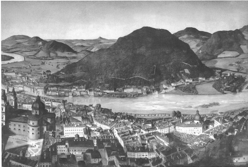
Abb. 1: Der Durchfluss der Salzach durch die Innenstadt von Salzburg. Ansicht aus dem Sattler-Panorama von 1825/1829, Detail. (Salzburg Museum, Inv.-Nr 1893-49)