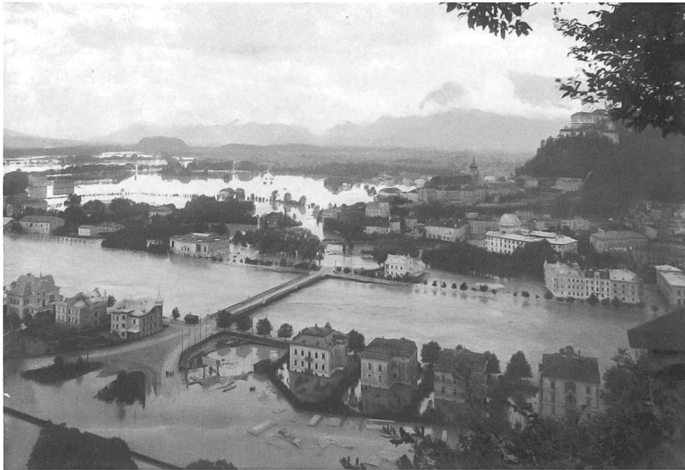
Abb. 3: Das Hochwasser vom September 1899 in der Stadt Salzburg vom Kapuzinerberg aus gesehen.

heit vermittelt. Eine Reihe derartiger Villenbauten zu beiden Seiten der neu errichteten Karolinenbrücke (Nonntalerbrücke) ist um 1900 gut zu erkennen (Abb. 2). In den Jahren 1897 und 1899 wurde der Ostalpenraum zweimal von massiven Überschwemmungen der Donau und ihrer Nebenflüsse heimgesucht; auch die Stadt Salzburg blieb davon nicht verschont. 9 Die Fotografien aus dem in Salzburg ansässigen Fotoatelier Würthle dokumentieren eindrücklich die Ereignisse von 1899. Die Abbildung 3 zeigt die Karolinenbrücke und die in diesem Bereich am Flussufer errichteten Villen, die allesamt vom Hochwasser eingeschlossen wurden. Gegenüber der Abbildung 2 ist die Perspektive umgedreht – der Blick ist vom Kapuzinerberg aus Richtung Südwesten gerichtet; rechts oben am Bildrand ist der Festungsberg zu sehen. 10 Auch eine Baustelle direkt am Brückenkopf steht völlig unter Wasser. Die Uferdämme wurden nach der Katastrophe von 1899 erhöht, zudem wurde das Flussbett eingetieft und auch ein Wasserkraftwerk oberhalb von Salzburg trug zur Regulierung der Salzach bei. So hielten die Dämme den Hochwasserereignissen von 1954, 2002 und 2013 stand, wenn auch 2002 nur wenige Zentimeter zu einer neuerlichen Überschwemmung der Häuser fehlten.