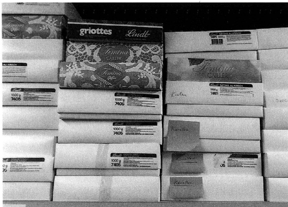
Abb. 1: Kirschstengeli-Schachteln, Sammlung Eiberle, Zoologisches Museum Zürich.