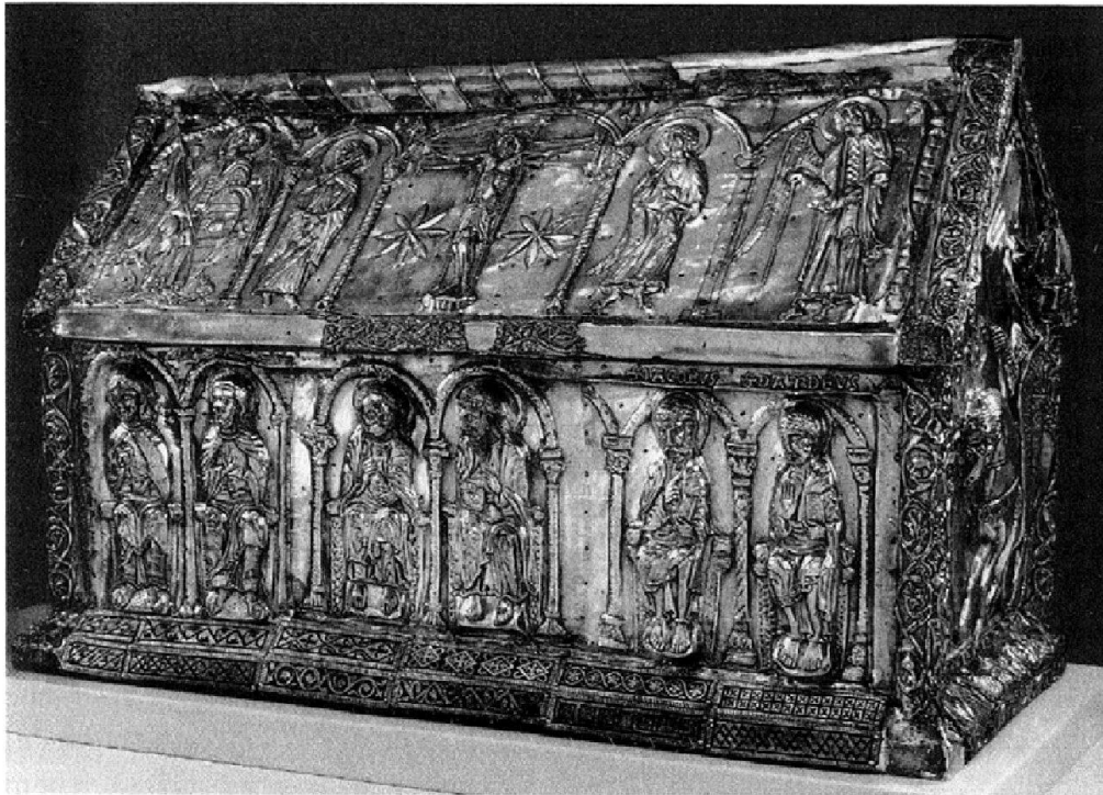
Fig. 1: Châsse des Enfants de saint Sigismond, Atelier de Saint-Maurice (?), deuxième moitié du 12e siècle et premier quart du 13e siècle. (Saint-Maurice d'Againe, Trésor de l'Abbaye)

champlevé sur l'une des faces de l'objet est extrêmement significative du point de vue de l'analyse matérielle des objets médiévaux. Ces plaques de cuivre en émail champlevé, datées de la fin du 12e ou au plus tard de la première moitié du 13e siècle, présentent un répertoire de motifs végétaux et géométriques, qui déroulent rigoureusement leurs formes régulières et stylisées parfois jusqu'à l'abstraction. Des plaques de même provenance, que l'on suppose provenir d'un plat de reliure voire peut-être d'une châsse démantelée, se retrouvent sur les petits côtés de la châsse de l'abbé Nantelme (au nombre de huit), châsse datée très précisément de 1225; 16 au sommet des arcades du socle du buste de saint Caudide (au nombre de trois), une pièce réalisée dans les années 1160–1165; 17 à la base du bras reliquaire de saint Bernard enfin, où l'on en compte quatre, un reliquaire dont on situe la date de fabrication autour de 1180 environ. 18 On admettait jusqu'à peu que la présence de ces plaques résultait d'un «travail de restauration» qui avait dû intervenir au 17e siècle, sous l'abbatit de Pierre IV Maurice Odet ou sous celui de Jean Jodoc de Quartéry. 19 Evidemment, cette interprétation s'accorde avec l'idée selon laquelle l'objet actuel présente des