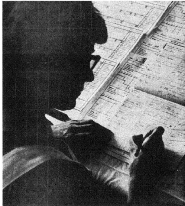
Abb. 6: «Beim Schein eines Nachtlämpchens schreibt die Schwester während der Nachtschicht ihre Rapporte. Das Verhalten, die Reaktionen und das Gebaren ihrer Patienten werden genauestens notiert und dem Arzt weitergegeben. Aufgrund dieser minutiös geführten Kurven entscheidet dieser über die weiteren Behandlungsmethoden.»

und im Gespräch den Kranken zu beobachten; sie sind es, die jede Veränderung miterleben, sie bemerken, welches die Reaktionen auf verschiedene Therapien sind, auf Änderungen in der Zusammenstellung und Dosierung der Medikamente: Gewissenhafte Beobachtung ist für den Arzt von grossem Wert, er kann darauf die Behandlung abstimmen.» 33