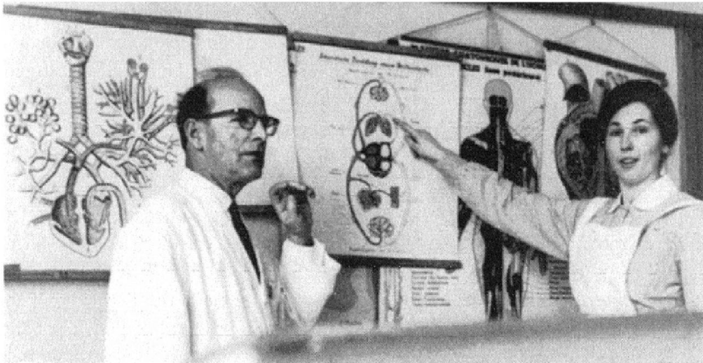
Abb. 5: «In vielen Kliniken unterrichtet auch der Chefarzt die zukünftigen Psychiatriseschwestern oder -pfleger. Der Lehrgang bis zum Diplom umfasst neben der praktischen Ausbildung theoretische Fächer, wie Anatomie, Physiologie, Gesetzeskunde, Pharmakologie, Krankenpflege etc.»

Auseinandersetzung, die in der Folge in der Zeitschrift «Praktische Psychiatrie» ausgetragen wurde. Bleuler wurde dort folgendermassen zitiert: «Der Pflegeberuf solle nicht zu 50 Prozent oder zu 10 Prozent ärztlich sein. Der Pflegeberuf in der Psychiatrie sei nicht ein Arztgehilfenberuf, sondern ein Stand für sich, der ärztlichen Tätigkeit gleichwertig, wenn auch auf anderer Ebene oder auf einer anderen Stufe. [...] Anatomie, Psychologie und theoretische Psychiatrie und derartige Fächer seien nicht mehr «in verdünnter Form» wie bisher zu lehren und zu prüfen, gewissermassen wie ein Fach der medizinischen Propädeutik. Solches sei Sache der Ärzte, nicht des Pflegepersonals.» 28 Anstelle einer quasi-wissenschaftlich-psychiatrischen Ausbildung sollte mehr Gewicht auf die Characterschulung des Personals gelegt werden. In dieser Diskussion um mehr Herz oder mehr Hirn in der Pflegeausbildung lautete schliesslich der Tenor, dass diese charakterlichen Belange nur schwer geschult werden können, sie jedoch ganz selbstverständlich dazu gehörten, wenn jemand als Psychiatriepflegerin oder -pfleger arbeiten wolle. 29 Die Mehrheit der Ärzteschaft und der Pflegenden befürwortete schliesslich eine Umstrukturierung der Ausbildung hin zu mehr Medizin, Psychiatrie sowie körperpflegerischer Praxis.