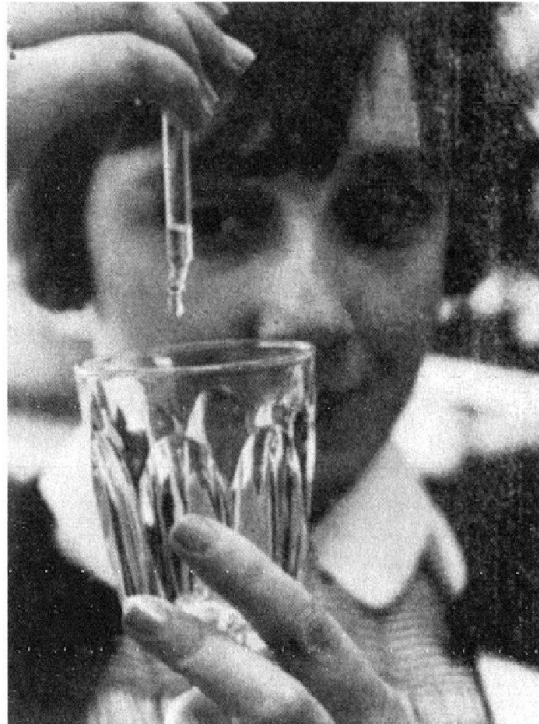
Abb. 3: Schweizerischer Verband für Berufsberatung in Verbindung mit der SZP (Hg.), «Gestalterische Beschäftigung». Berufsbild Diplomierte Psychiatrieschwester/Diplomierter Psychiatriepfleger, Zürich 1974.

der Beruf tatsächlich körperlich weniger anstrengend geworden. Erregte und laute Patientinnen und Patienten waren seit der Einführung der Psychopharmaka seltener. Ein Pfleger beschreibt diesen Wandel bereits 1955 mit den folgenden Worten: «Unser ganzes Berufsleben hat sich heute derart fortschrittlich gestaltet, dass ein Vergleich mit der Vergangenheit keineswegs gezogen werden darf. Entgegen der Volksmeinung sind wir nicht mehr «Wärter», sondern Pfleger ; wir haben nicht mehr das Amt eines «Aufsehers» inne, sondern sind bestrebt, als Pfleger den kranken Menschen zu helfen. Diese neue Aufgabe erfordert eine individuelle Behandlung des Kranken. Daraus folgt, dass wir heute eine gründlichere Ausbildung brauchen als früher.» 14