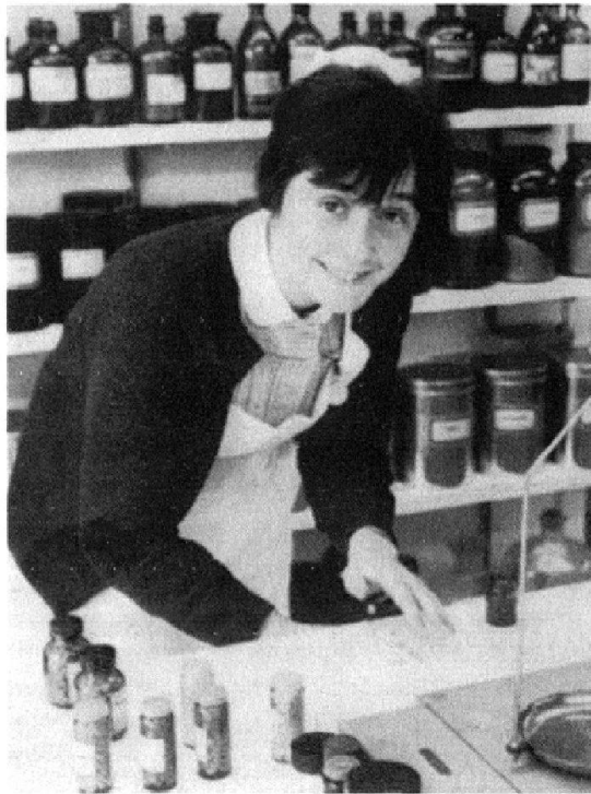
Abb. 2: «Die Psychiatriseschwester betreut ihre Patienten auch medikamentös. Sorgfältig und sich ihrer Verantwortung bewusst verabreicht sie die vorgeschriebene Dosis».