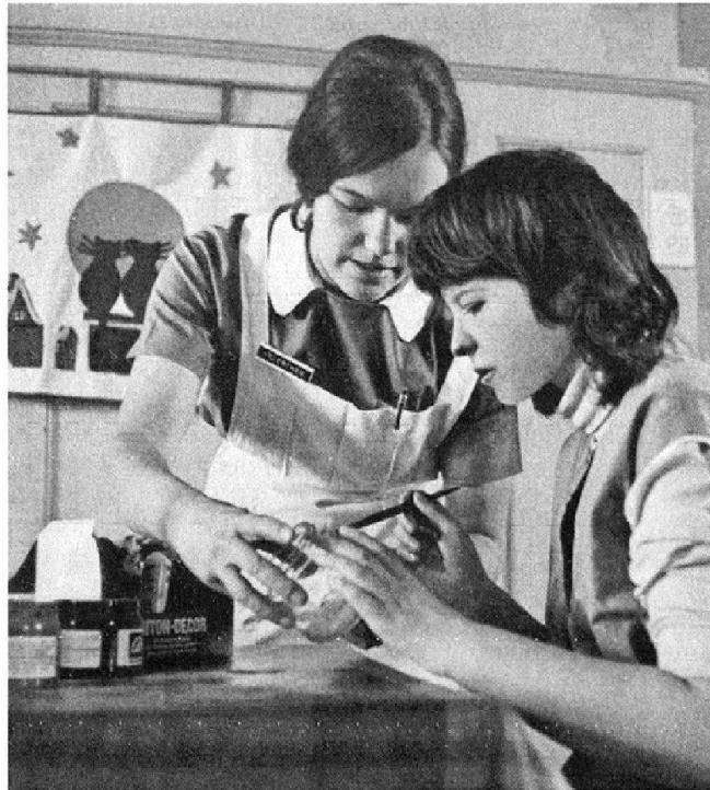
Abb. 4: «Sorgfältig und gewissenhaft wird die Dosierung der Medikamente für die Patienten vorgenommen.»

Chlorpromazin-Tabletten beim Pflegepersonal auslösten. Ausserdem sei ihr Geschmack für die Patientinnen und Patienten unerträglich. Sie erreichten in der Folge eine Umstellung auf beschichtete Pillen mit angenehmerem Geschmack und besserer Hautverträglichkeit. 19 In einer weiteren Klinik bewirkte das Pflegepersonal einen Wechsel von den schmerzhaften Injektionen zur patientenfreundlicheren Tablettenform. 20