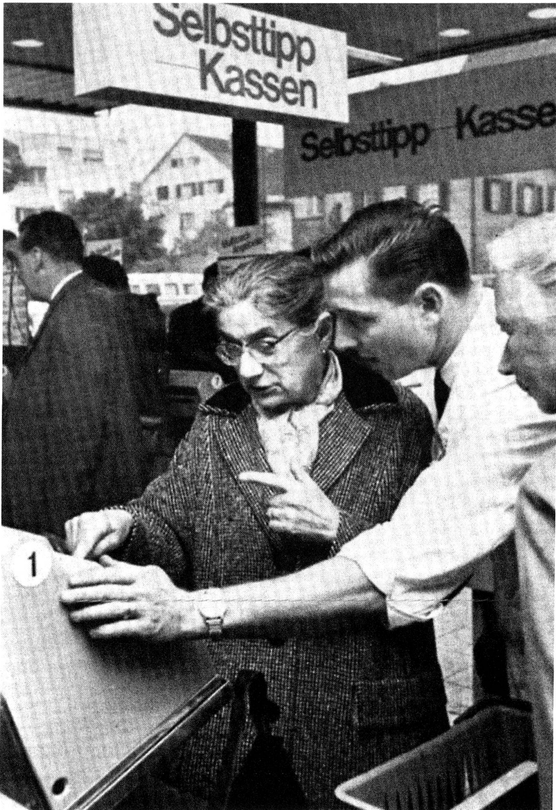
«Alles ganz einfach», sagt der junge Verkäufer zu der Kundin und zeigt ihr, wie man seine gekauften Waren selbst eintippt.» («Neues Kassier-System im Migros-Markt Wollishofen», Selbstbedienung und Supermarkt 12 [1965], 5)