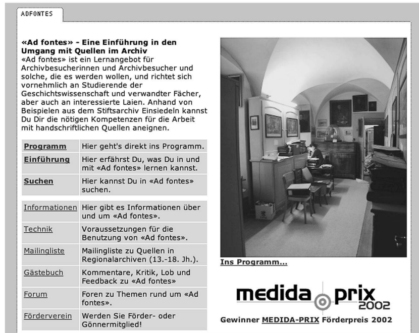
Abb. 2: Startseite von «Ad fontes».

schliessungstechniken (Regesten, Transkription, Edition, Übersetzung, Datenbank) und ein Kapitel zu den Problemen bei der Auswertung der Quellen (Quellenkritik, Quellentypologien, Schriftlichkeit, Besonderheiten einzelner Quellentypen).