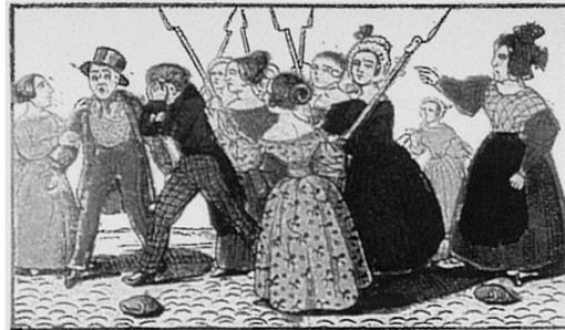
Les femmes font la patrouille.