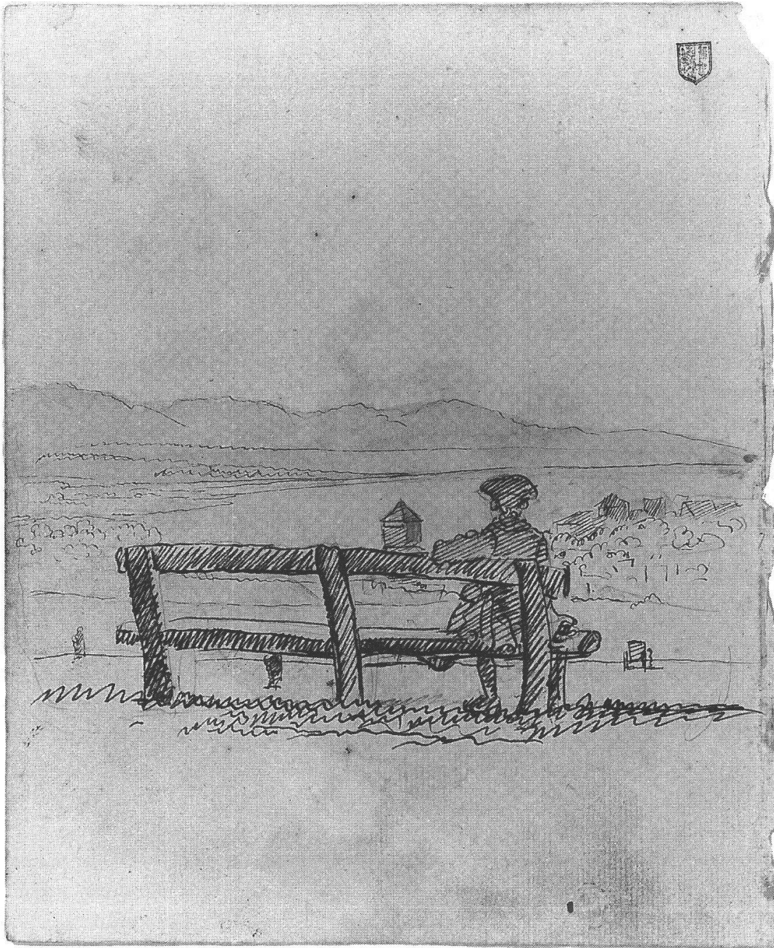
Illustration 1: Personnage vu de dos, regardant le lac. Vers 1765. Jean Huber, dit l'Ancien (1721–1786). (Musée d'Art et d'Histoire de Genève)

le lac et les rivières. Le premier est longuement décrit selon ses caractéristiques physiques (dimension, profondeur, vents, etc.) ou ses ressources. Dans les dernières décennies du XVIII e siècle, quand les voyageurs ont lu Rousseau, il devient le lieu par excellence de la rêverie et de la méditation solitaire. Conscients de l'importance de l'eau dans la vie de la cité, quelques récits, renonçant un instant à la vision unitaire de la ville qui prévaut généralement dans les textes, s'attachent à décrire les ■ 19