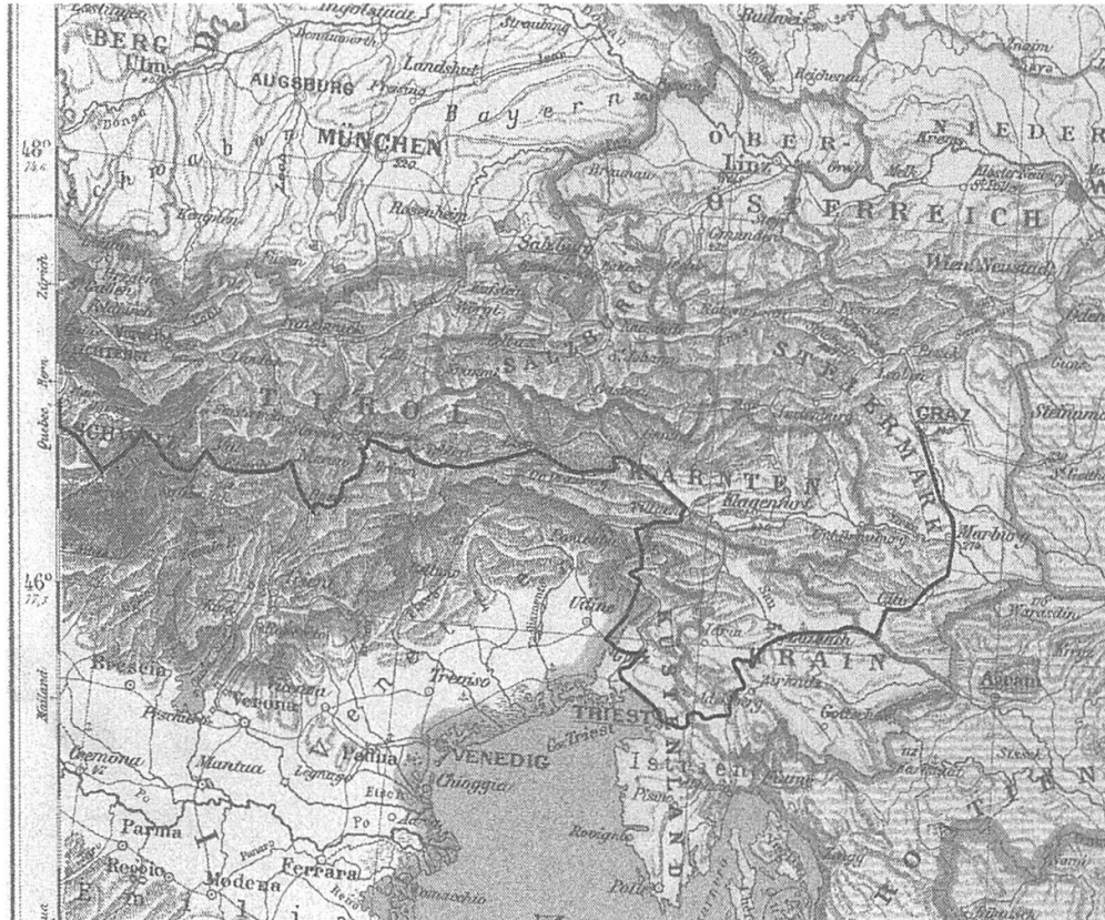
Abb. 1: Grimms Reiseroute von Graz via Triest und Bozen nach Wald ZH.

jahre» und «4. Episoden aus dem Kampf». Zweitens führte Grimm von seiner Rückreise ab Graz zwischen dem 4. Mai und dem 30. Juni 1902 ein Tagebuch. 6 Das gut 100 Seiten umfassende Büchlein in handlichem Format ist in erstaunlich gutem Zustand angesichts der langen und strapaziösen Wanderungen durch Regen und Schnee, die es mit seinem Besitzer durchgemacht hat. Zum Schreiben verwendete Grimm stählerne Spitzfedern mit schwarzer Tinte. Die Titelseite der «Reiseerinnerungen» hat er mit «Porrentruy, den 10. Sept. 1902» versehen, nachdem er dort am 1. September eine Stelle bei der Druckerei der Zeitung Le Jura angetreten hatte.