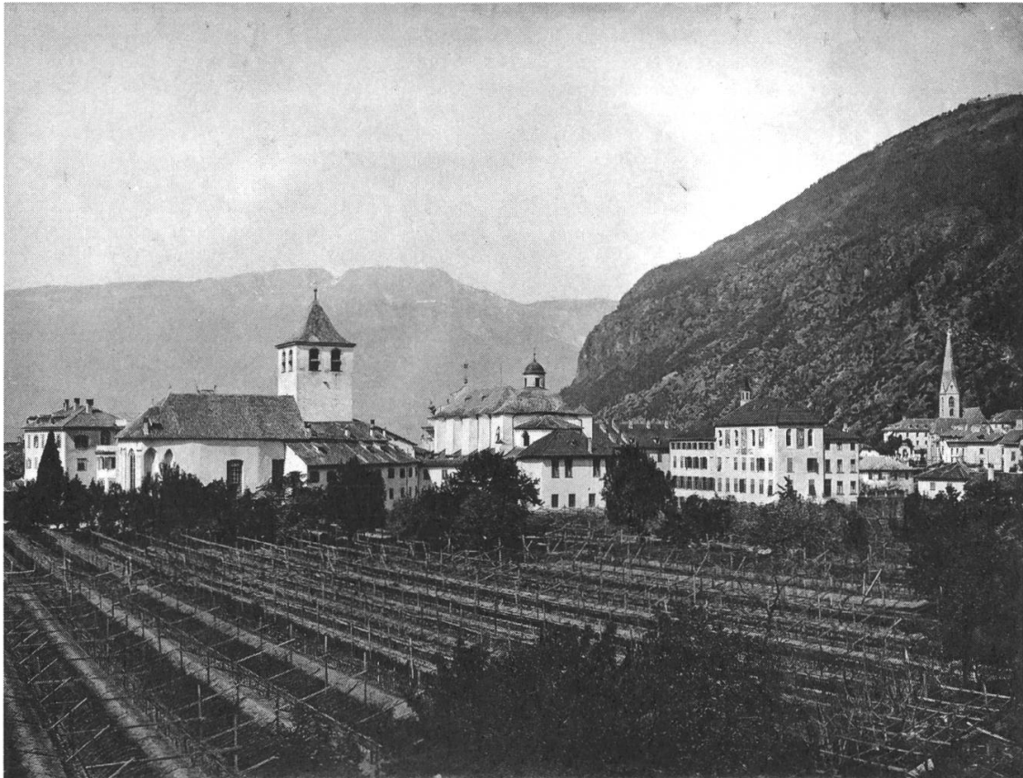
Abb. 4: Kloster Gries mit Weingarten, Stiftskirche, Pensionat und alter Pfarrkirche (von links nach rechts).

mehr Schüler aufgenommen werden. Insofern entwickelte sich im Laufe des 19. Jahrhunderts wieder eine prosperierende Klosterwirtschaft. 46