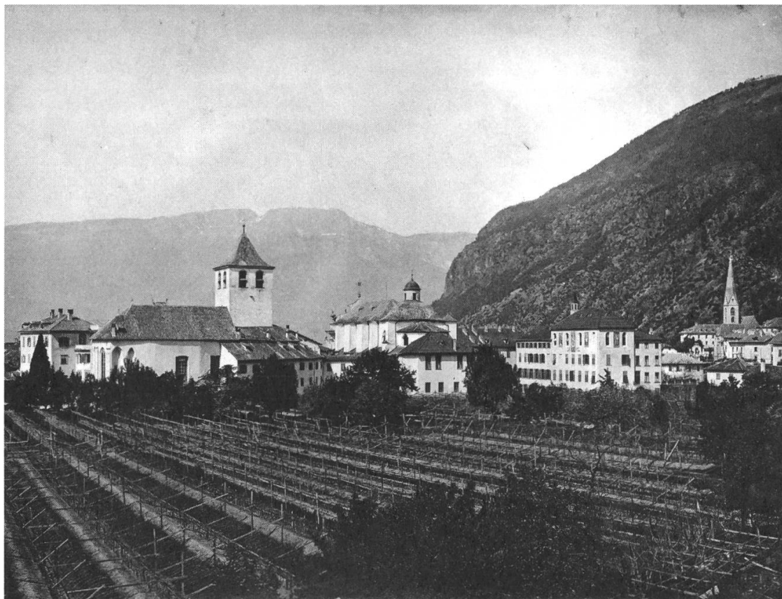
Abb. 4: Kloster Gries mit Weingarten, Stiftskirche, Pensionat und alter Pfarrkirche (von links nach rechts).

mehr Schüler aufgenommen werden. Insofern entwickelte sich im Laufe des 19. Jahrhunderts wieder eine prosperierende Klosterwirtschaft. 46