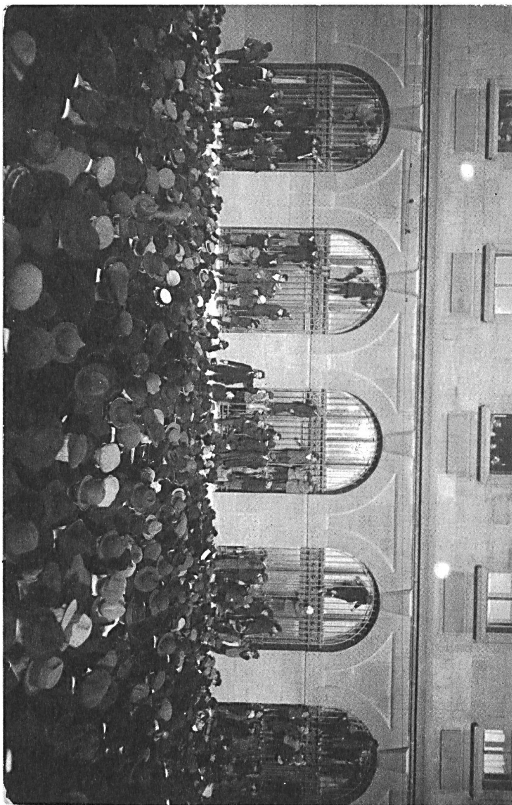
Jules Humbert-Droz, au centre, s'adresse aux grévistes qui occuperont ensuite les voies pour empêcher le départ d'un train, La Chaux-de-Fonds, 14 novembre 1918. Carte postale, [s.l.] : [s.n.].