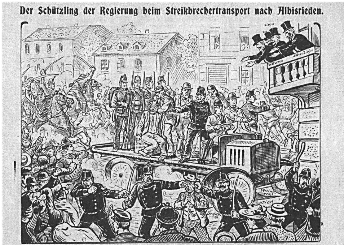
Die grütlianische Satirezeitschrift Der Neue Postillon zum Zürcher Streiksommer 1906.

der Sozialdemokratie für ein Verbot solcher Einsätze aus. 25 Damit hatten sich Ordnungstruppen als Feindbild etabliert, das im November 1918 die militärische Besetzung Zürichs zu einer ungeheuren Provokation machen sollte.