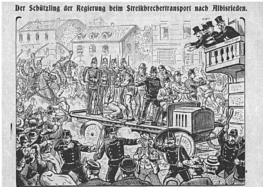
Die grütlianische Satirezeitschrift Der Neue Postillon zum Zürcher Streiksommer 1906.

der Sozialdemokratie für ein Verbot solcher Einsätze aus. 25 Damit hatten sich Ordnungstruppen als Feindbild etabliert, das im November 1918 die militärische Besetzung Zürichs zu einer ungeheuren Provokation machen sollte.