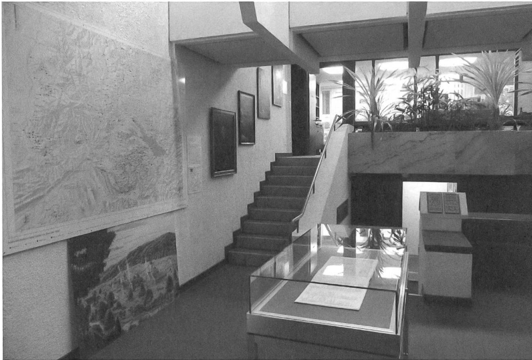
Abb. 4: Das Stiftsarchiv St. Gallen im Nordflügel des St. Galler Regierungsgebäudes, wo das wertvolle Erbe seit 1978 untergebracht ist.