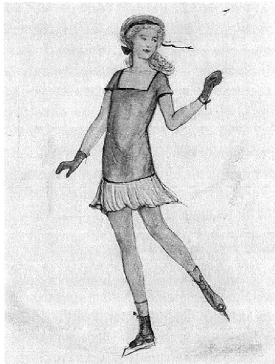
Abb. 2: «Wunschvorstellungs- zeichnung eines Kältefetischisten». (Aus: Sammelmappe aus Eugen Wolbe, Handbuch für Autographen- sammler , Berlin 1923, S. 271)

Auch Hirschfeld tastete sich nur vorsichtig auf diesem, ihm wenig vertrauten Gebiet menschlicher Perversion voran. Doch ein Vergleich mit anderen Opfern der grassierenden «Sammelwut» konnte manches deutlich machen: «Sicherlich bietet die Einreihung und Einordnung eine der wichtigsten Eigenschaften eines jeden Sammlers, auch des fetischistischen», so räsonierte er, «aber von vielen wird sie immer wieder aufgeschoben, hingezogen, in dem Bestreben, immer mehr Material aufzustapeln, das später unter bestimmten Gesichtspunkten gesichtet werden soll». 29 Der Impuls zu sammeln konnte stärker werden als die Sammelpraxis selbst. Dabei blieb ein signifikanter Unterschied zu verwandten Formen abweichenden Verhaltens, etwa der Kleptomanie. Dabei ginge es nicht wie beim Fetischismus oder der «Sammelwut» um das Objekt selbst, sondern um dessen Aneignung. 30