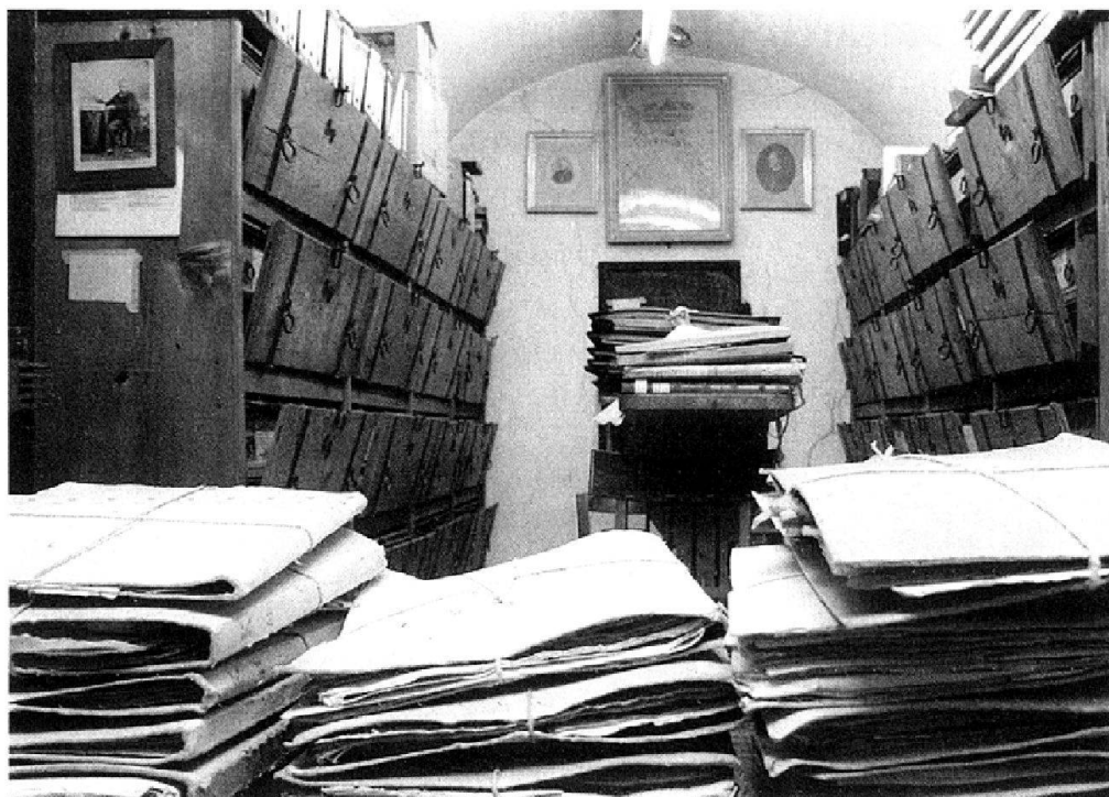
Abb. 1: Das Klosterarchiv vor der Reorganisation. Im Vordergrund Faszikel, die keinen Platz mehr in den alten «Trucken» hatten. Auf den Archivschränken: Diverse ungeordnete und nicht verzeichnete Unterlagen mit unklarer Provenienz.

Das Archiv rückte im Kloster und in der Öffentlichkeit immer mehr ins Bewusstsein – und damit auch der notwendige Handlungsbedarf. Die Zustände waren besorgniserregend. Die Findmittel stammten hauptsächlich aus dem 18. Jahrhundert. Etwa die Hälfte der Unterlagen, die 2004 in den Archivräumen lagen, war weder geordnet noch verzeichnet. Es fehlte offensichtlich an Platz. Das Archiv war noch immer in den alten Klosterzellen untergebracht. 2 Unterlagen, die seitdem hinzukamen, wurden notdürftig in Schachteln oder gänzlich ungeschützt auf die Archivschränke, unter die Tische, in Schränken auf dem Gang und Ähnlichem versorgt. Im besten Fall verblieben die historischen Akten vor Ort und wurden dort «zwischenarchiviert», im schlimmsten Fall wurden Unterlagen vollständig vernichtet. Innerhalb des Klosters wusste man zwar, dass ein Archiv vorhanden war. Wer wann was dort abzuliefern hatte, war allerdings unklar: Die letzte, und damit theoretisch noch gültige, aber unbekannte Archivverordnung datierte aus dem Jahr 1773. 3