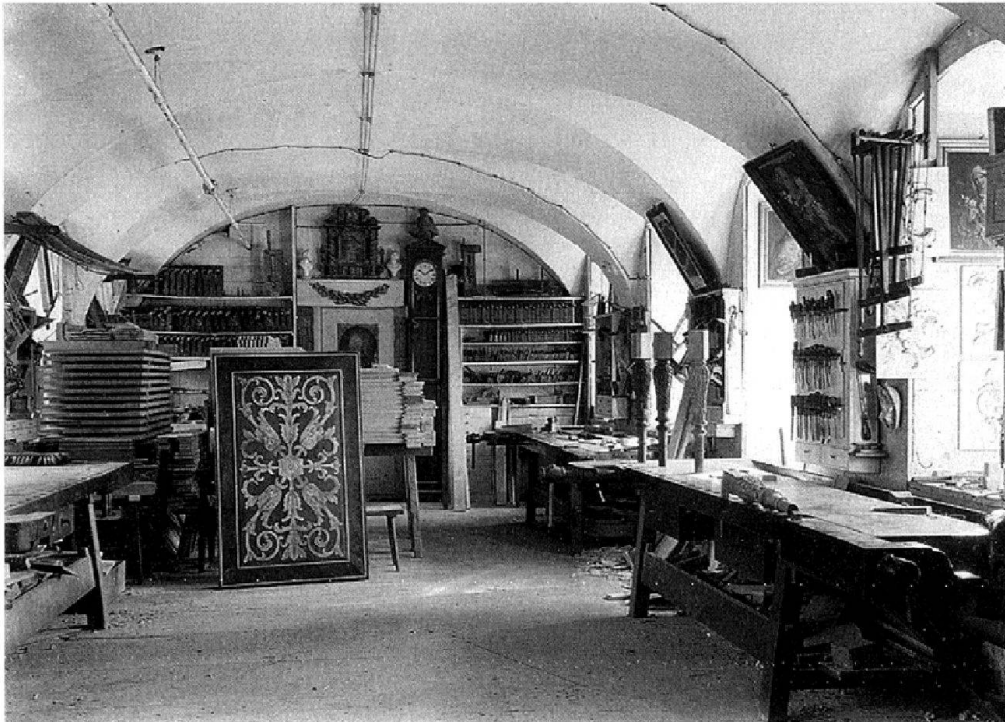
Abb. 4: Alte Schreinerei, circa 1910. Der Lesesaal und die Arbeitsräume des neuen Archivs sind in diesen Räumen untergebracht (KAE, Glasplatte 05400).

Zurzeit werden die Dias und Negativfilme digitalisiert und verschlagwortet. Bis Ende 2012 sollen insgesamt circa 30'000 Bilder im Bildarchiv online zur Verfügung stehen.