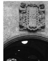
Volkshäuser – eine neue Bauaufgabe im 20. Jahrhundert Les Maisons du peuple – une nouvelle tâche architeturale a u XX o secolo Le Case del popolo – un nuovo tema progettuale del XX secolo

2009 Kunst + Architektur in der Schweiz Art + Architecture en Suisse Arte + Architettura in Svizzera