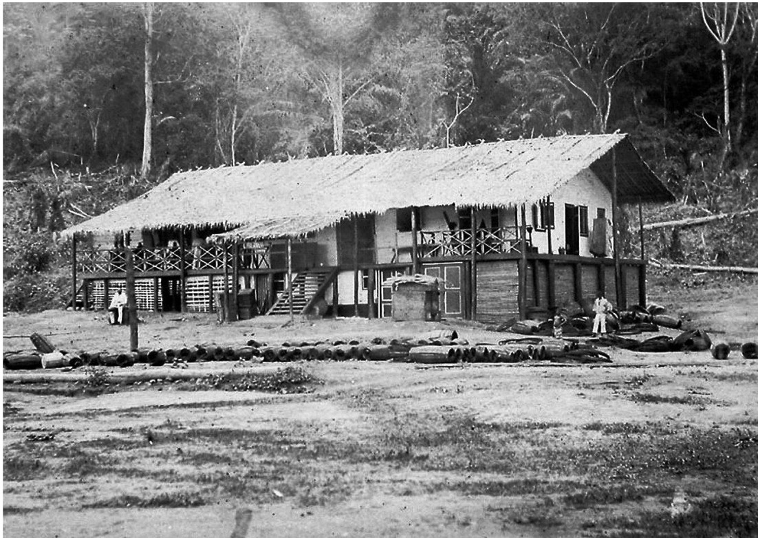
Abb. 4: Faktorei der Hamburger Reederei und Handelsfirma Woerrman am Ogowe in Gabun. Vor dem Gebäude sieht man Bündel von Fassreifen und Fassdauben. Die Fässer zum Transport von Palmöl wurden, um Platz zu sparen, erst bei Gebrauch zusammengebaut.

den Handelshäusern und den lokalen Chiefs und die Versuche, den Markt zu erobern, stärkte letzten Endes die Kräfte, die zur kolonialen Eroberung gegen Ende des 19. Jahrhunderts führten. Die landwirtschaftliche Produktion für den Export durch die Handelshäuser hatte einen tief greifenden sozialen und wirtschaftlichen Wandel zur Folge. Transportiert wurden in diesen Prozessen neben Menschen und Waren auch Vorstellungen und Wissen. Deutlich wird das etwa in der Abbildung von King Akwa, einem der Repräsentanten der Dualas in Kamerun zur Zeit der kolonialen Auseinandersetzungen zwischen Deutschland und England (Abb. 5). Vermutlich liess Akwa das Foto selbst anfertigen. Stuhl, edles Tuch, Stock, Elfenbeinreifen und Zylinder zeugen von der Würde, dem Reichtum und der Macht King Akwas. «Die Symbole der Macht [...]», so kommentiert die Historikerin Stefanie Michels, «wurden jedoch von den europäischen Beobachtern konsequent negiert beziehungsweise konterkariert. Die wirkungsvollste Strategie dazu bestand in der Erzeugung einer Groteske, über die Europäer lachen konnten. Die groteske Wirkung beruhte vor allem darauf, dass die Symbole bourgeoiser deutscher Männlichkeit schlechthin, der schwarze