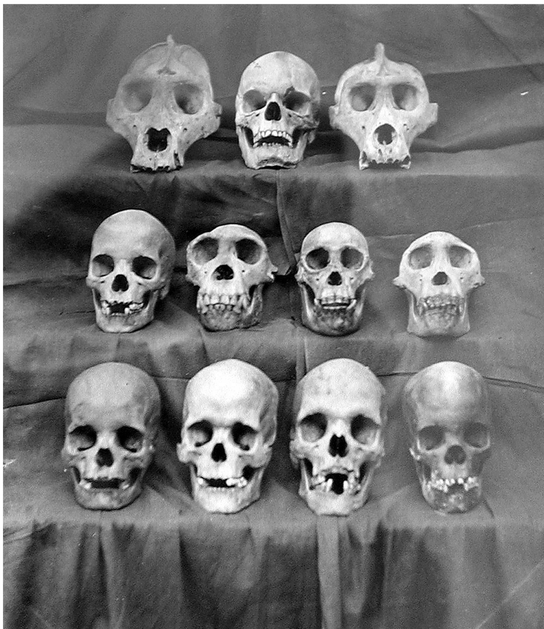
Abb. 7: Im Passavant-Album heisst es dazu: «Neger-Schädel zur Doctor-Dissertation von Karl Passavant.» In Wirklichkeit sind hier neben Menschenschädeln auch einige Affenschädel zu sehen.

der Anatomie und physischen Anthropologie – entschied sich Passavant für das Thema seiner Dissertation mit dem Titel Craniologische Untersuchungen der Neger und der Negervölker . 3 Im ersten Satz des Vorworts heisst es: «Bei einer Umschau über die auffallenden Abarten des Menschengeschlechtes, welche der afrikanische Continent beherbergt, scheint es mir geboten, dass der Craniologe seine Stellung zu der Rassenfrage darlege.» Passavant, dem Credo der Zeit folgend,