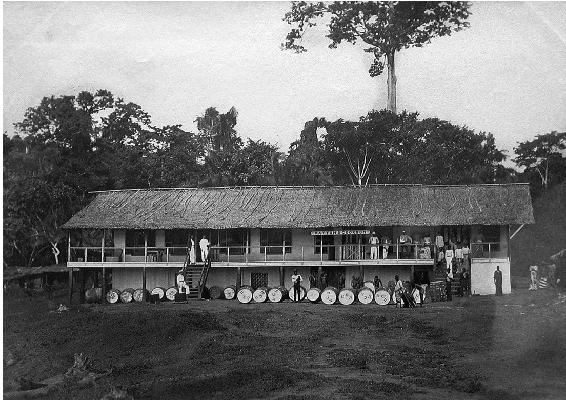
Abb. 3: Faktorei der englischen Firma Hatton & Cookson, Ogowefluss, Gabun. Vor dem Gebäude sind Fässer zum Transport von Palmöl erkennbar.

komplexen Netzwerks von Produktion, Handel und Verbrauch, das bis ins Innere des Kontinents reichte (Abb. 3 und 4). Eine gemischte Einwohnerschaft traf an diesen Stationen aufeinander: afrikanische Händler, zu denen die lokalen Chiefs wie auch Kleinhändler gehörten; europäische Händler und die Missionare, die auch einige Faktoreien betrieben. Mit dem wachsenden Export von Palmöl fanden zugleich importierte Massenwaren in ganz Westafrika Verbreitung: Lebensmittel, Kleider und Güter aller Art.