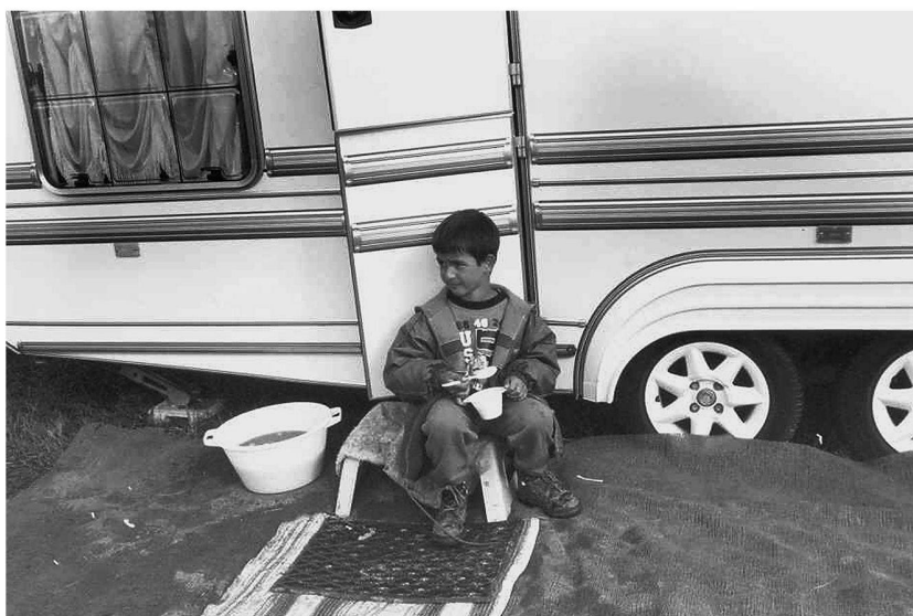
72 ■ Photo camp tsigane 1.

Photo camp tsigane 3: Cet homme est d'origine manouche. Il est un des trois tsiganes à avoir posé pour Clara. Cette scène montre le fils aîné du chef du camp en train de teindre un ours en bois en vue de le vendre à l'occasion d'un marché.