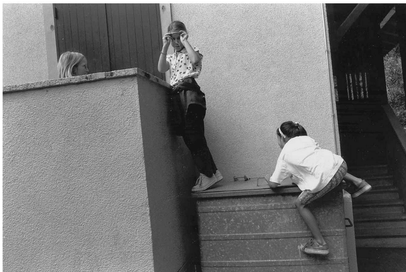
Photo écoliers 1.