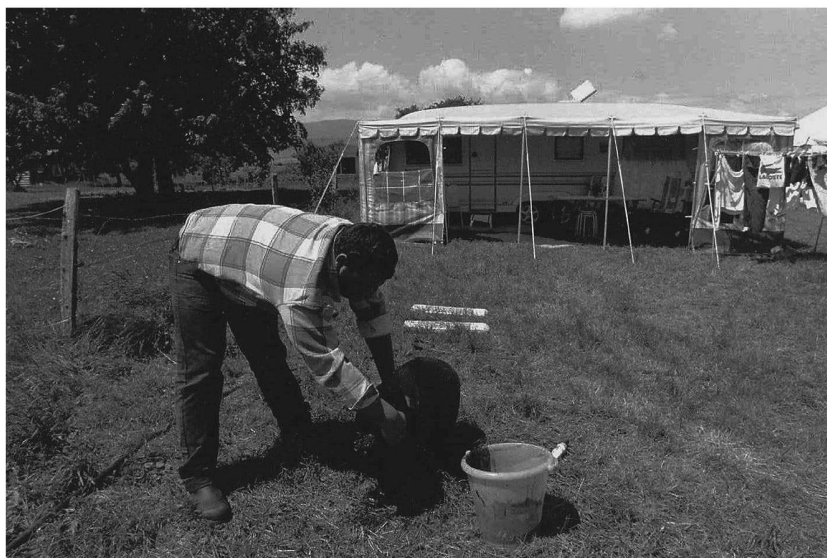
Photo camp tsigane 3.