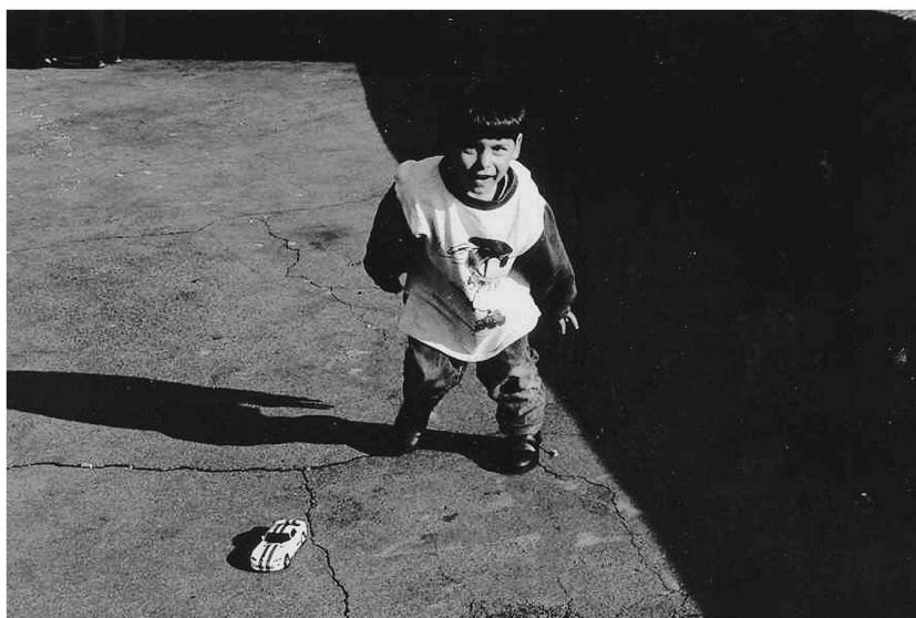
Photo enfant 1.