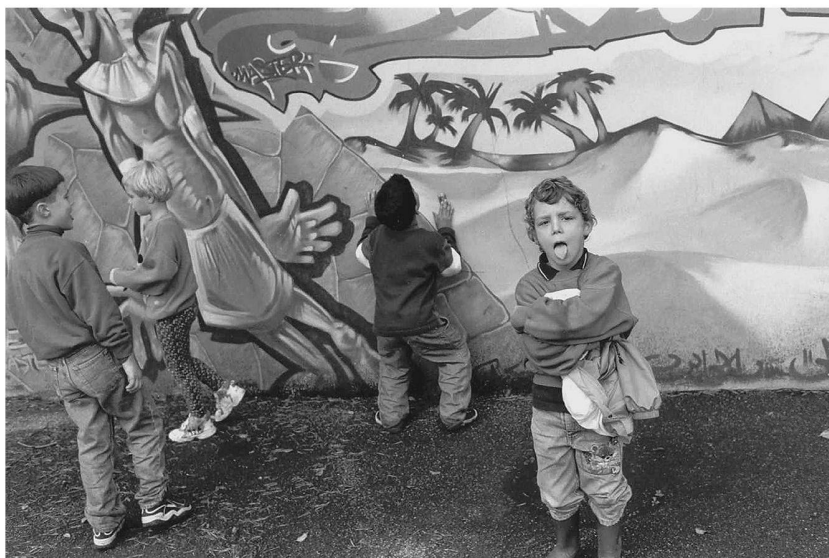
Photo écoliers 2.