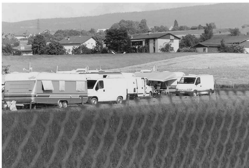
Photo camp tsigane 2.