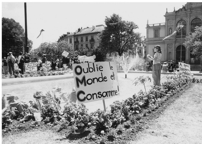
122 ■ Manifestation anti-OMC, 25 juin 2000, Genève. Espace convivial!