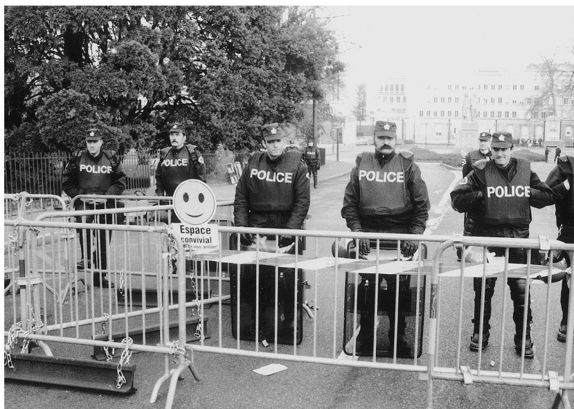
Manifestation anti-OMC, 25 juin 2000, Genève. Espace convivial?