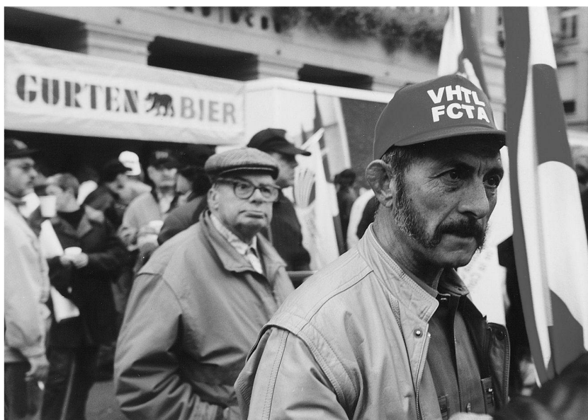
Manifestation contre la révision de la Loi sur le personnel de la Confédération et contre les salaires en dessous de 3'000 frs, 4 novembre 2000, dans les rues et sur la place fédérale de Berne, près de 25'000 personnes.