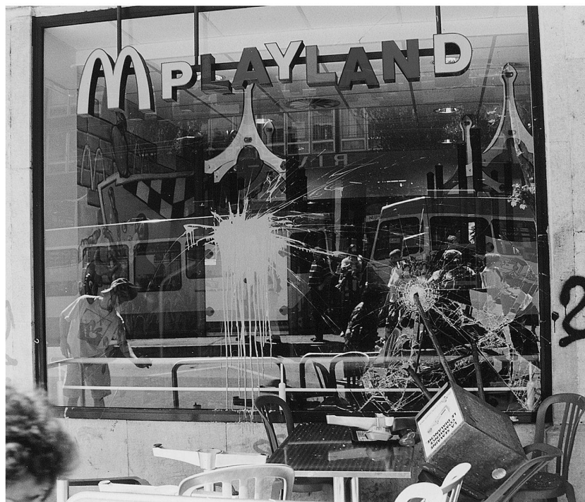
Manifestation anti-OMC (Organisation Mondiale du Commerce), 16 mai 1998, Genève, plus de 15'000 personnes. Lors d'une des premières grosses manifestations internationales contre la mondialisation des transnationales avant Seattle, de nombreuses vitrines de grandes firmes ont été prises pour cibles.