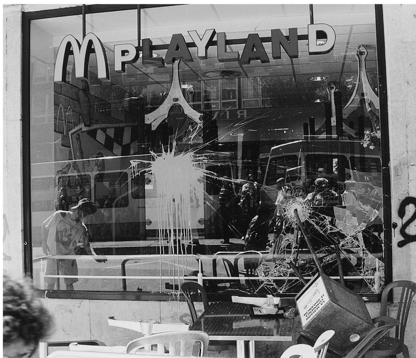
Manifestation anti-OMC (Organisation Mondiale du Commerce), 16 mai 1998, Genève, plus de 15'000 personnes. Lors d'une des premières grosses manifestations internationales contre la mondialisation des transnationales avant Seattle, de nombreuses vitrines de grandes firmes ont été prises pour cibles.