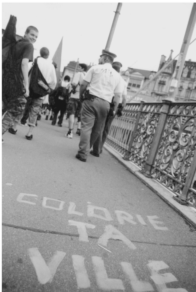
Street Party 2, 3 juin 2000, Lausanne. Avant de repeindre entièrement la rue des banques à St-François, des participants à la manifestation appellent à colorier sa ville (et sa police) pour récupérer les rues.